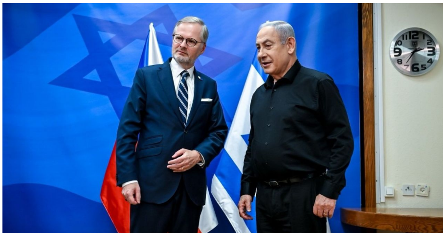
Péťa s Bibim u hodin na zdi

Tohle asi Bibi ještě nezažil, protože jeho výraz a neuvěřitelný pohled na Fialu, jak mu čte pozdravy a podporu Izraeli z papíru, to nepotřebuje komentáře. Faktem však je, že na rozdíl od Zelenského má Fiala dveře do Izraele otevřené, a to i vzhledem k historickým konotacím, kdy Československo po vzniku Izraele v roce 1948 vyzbrojovalo nově vzniklý stát a poskytlo mu vyřazené československé stíhačky Avia S-199, což byly repasované německé stíhačky Messerschmitt Bf 109G vyráběné za okupace ke sklonku války v závodech Letov v Praze v Letňanech, kam byla přenesena výroba z Německa kvůli permanentnímu bombardování Porúří spojeneckými bombardovacími svazy.