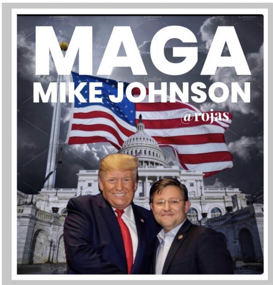
Donald Trump a Mike Johnson

A ihned poté se IDF z Gazy stáhla zpět! Podle amerického tisku čeká Izrael s plným rozvinutím invaze na rozmístění amerických protivzdušných systémů v Izraeli, a to nejen okolo pásma Gazy, ale hlavně na severu Izraele, kde se očekává invaze Hizballáhu do Izraele.