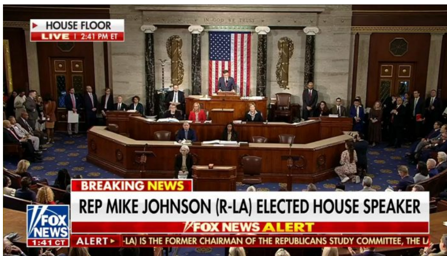
Projev Mikea Johnsona v kongresu

Dodávky zbraní a stíhaček Izraeli byly prokuraturou v roce 1952 vnímány jako podpora sionismu usilujícího o světovou vládu a útisk a vykořisťování dělnického hnutí. Izrael na tu podporu z Československa nezapomíná, ale vsadím se, že na středeční bizár v podobě Fialy předčítajícího Bibimu pozdrav z papíru asi Izrael také nezapomene. Jenže ve středu se v souvislosti s Izraelem odehrálo něco mnohem podstatnějšího, a to v USA.