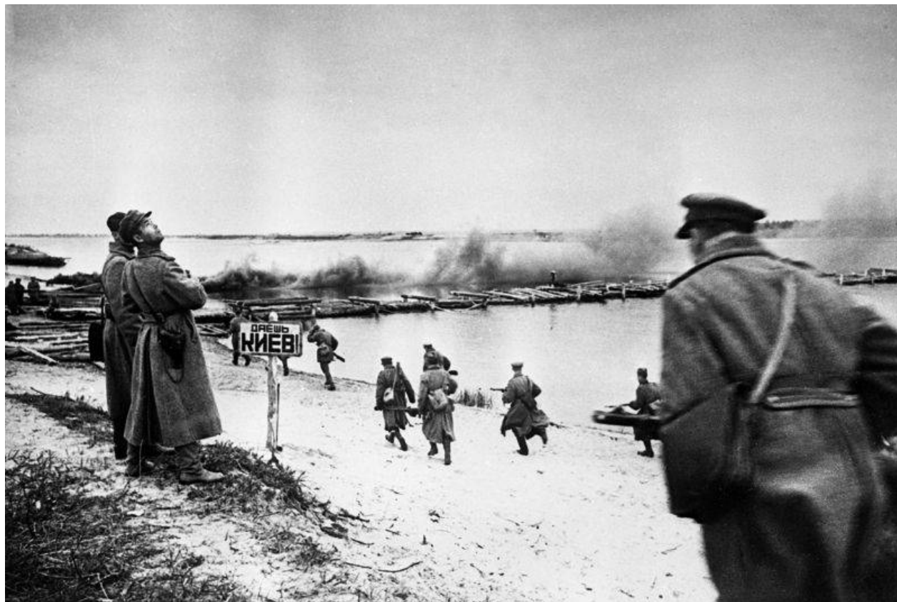
Sovětskí sapéři budují přechod přes Dněpr severovýchodně od Kyjeva. Podzim 1943