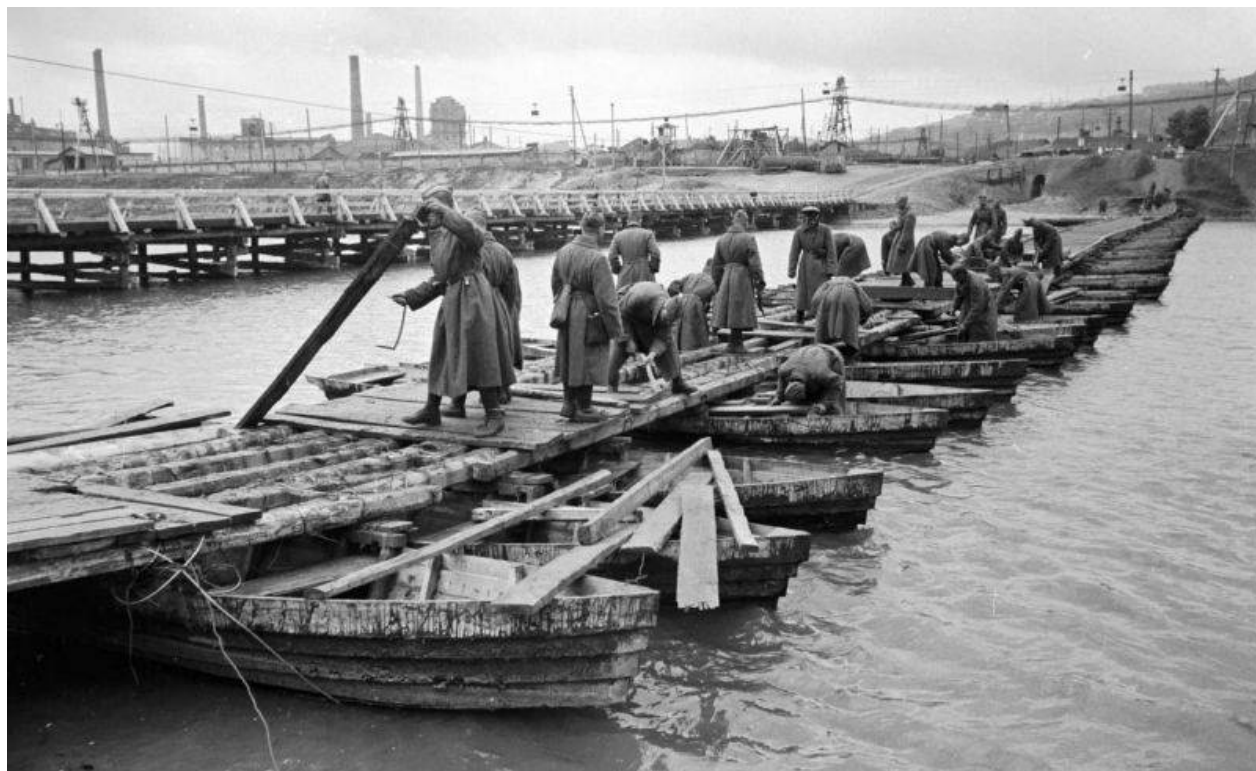
Sovětští sapéři staví most přes Severský Doněc v osvobozeném Lisičansku. září 1943