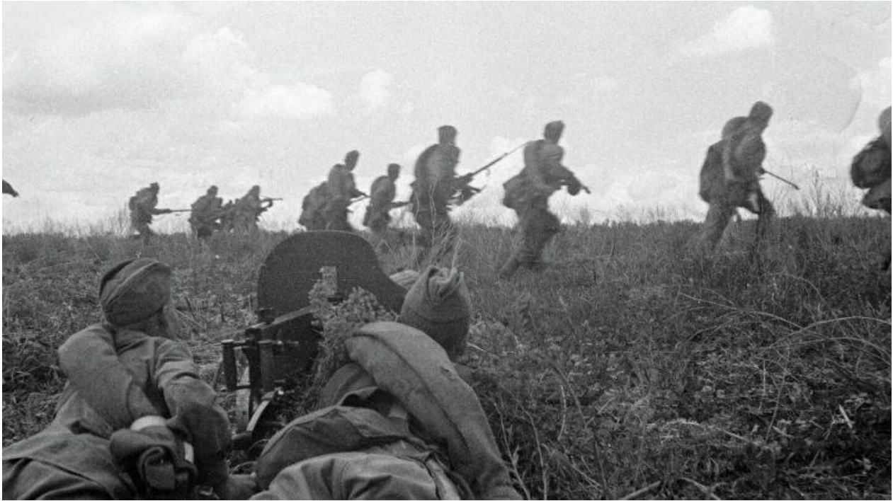
Kulometníci s „Maximem“ podporují útok bojovníků Jihozápadního frontu v ofenzivě západně od Slavjanska.