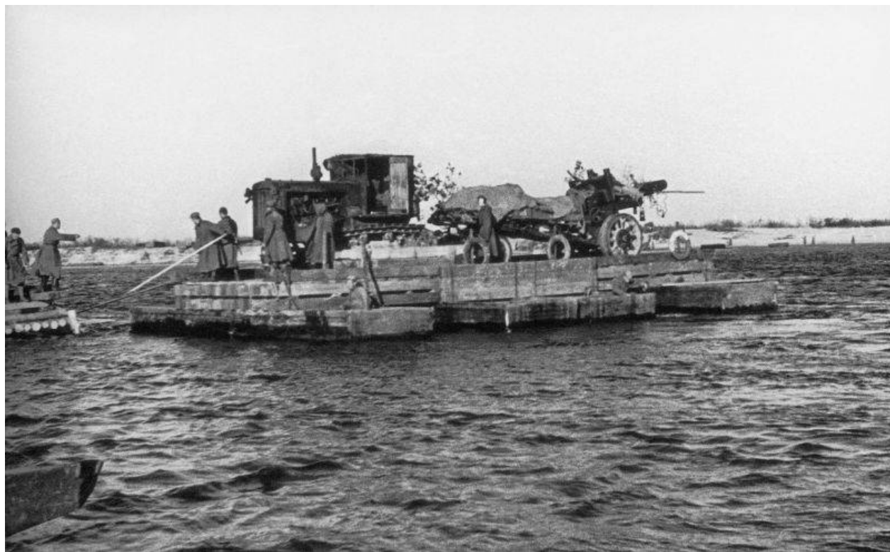
Přejezd sovětského tahače S-65 "Stalinets" s 152mm houfnicí model 1937 (ML-20) přes Dněpr trajektem.