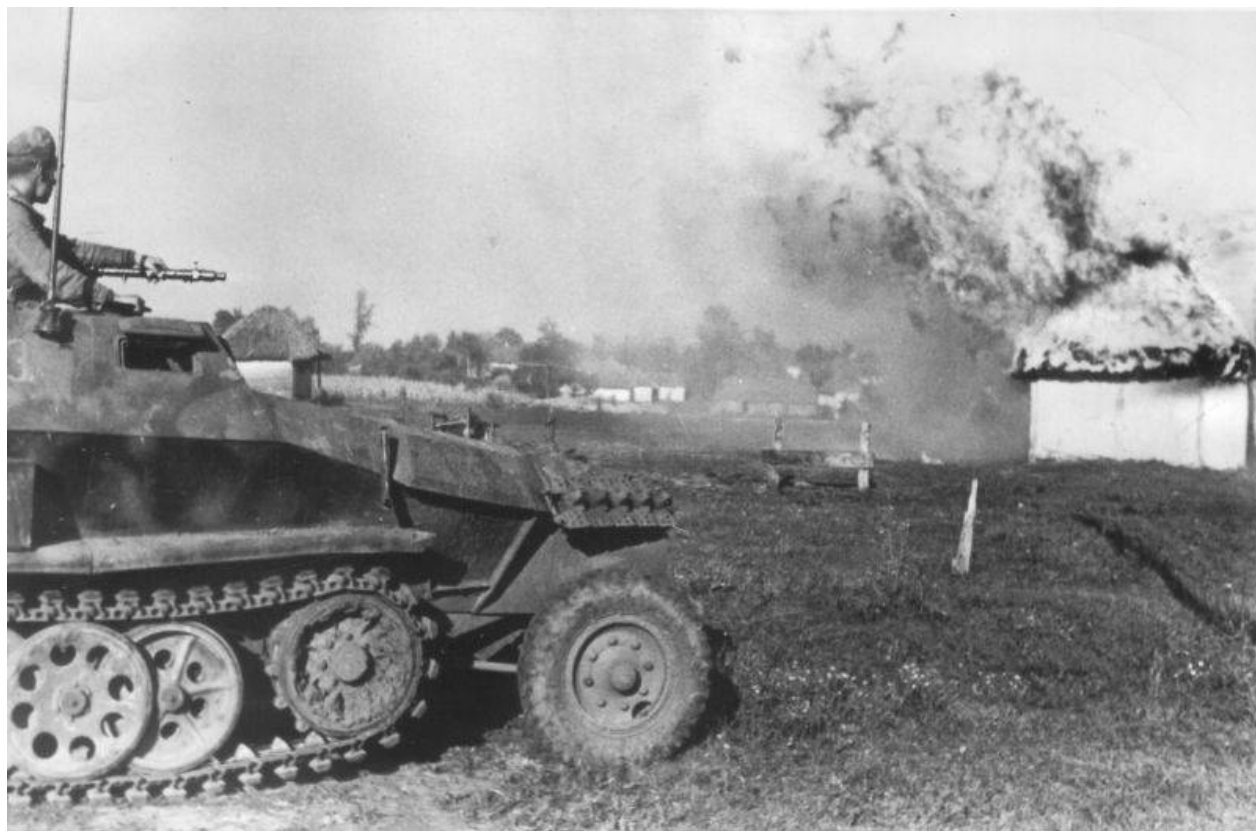
Německý obrněný transportér Sd. Kfz. 251 u hořícího domu v ukrajinské vesnici poblíž Dněpru. září 1943

Stále probíhaly bitvy o Charkov a Rudá armáda, inspirovaná vítězstvím, se hnala vpřed. Osm sovětských front, které čítaly 4,5 milionu lidí v jejich řadách, společně i odděleně, střídavě a současně útočilo na dvoutisícovou německou frontu. Wehrmacht nedokázal udržet všechny pozice a postupně se stáhl zpět, ale zachoval si vysoký bojový potenciál, vedl aktivní obranu.