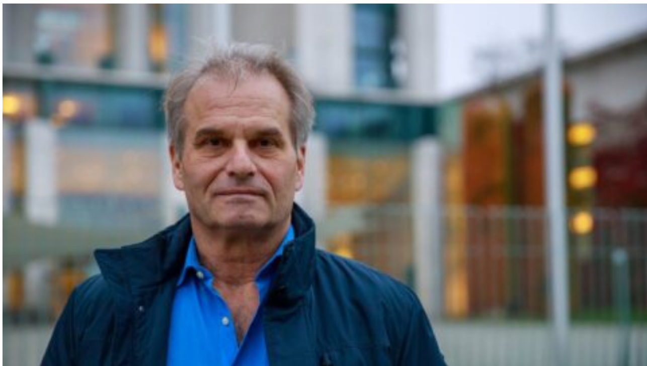
Známý kritik pandemických opatření, německý právník Rainer Fuellmich, je ve vazbě. Čelí obvinění ze zpronevření peněz