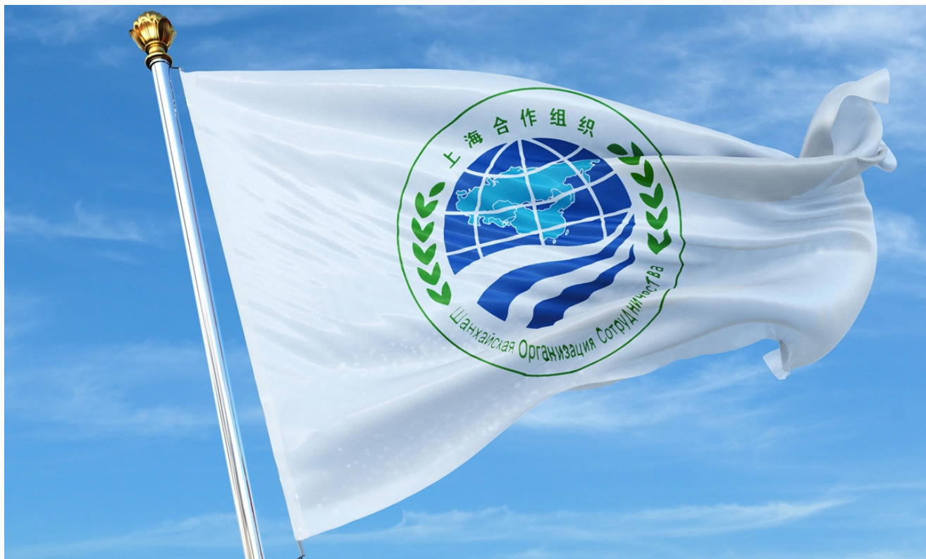
Šanghajská organizace spolupráce

Očekává se, že Čína a pět středoasijských zemí v příštích deseti letech přinesou více modernizovaných projektů hospodářské spolupráce poznamenaných zelenou digitální ekonomikou, uvedli experti po hmatatelných výsledcích, které přinesly příležitosti uvolněné právě skončeným třetím Pásmem a stezkou. Fórum pro mezinárodní spolupráci (BRF), které připomnělo 10. výročí iniciativy Pás a stezka (BRI) a zahájilo to, co čínský prezident Si Ťin-pching nazval další „zlatou dekádu“ spolupráce BRI.