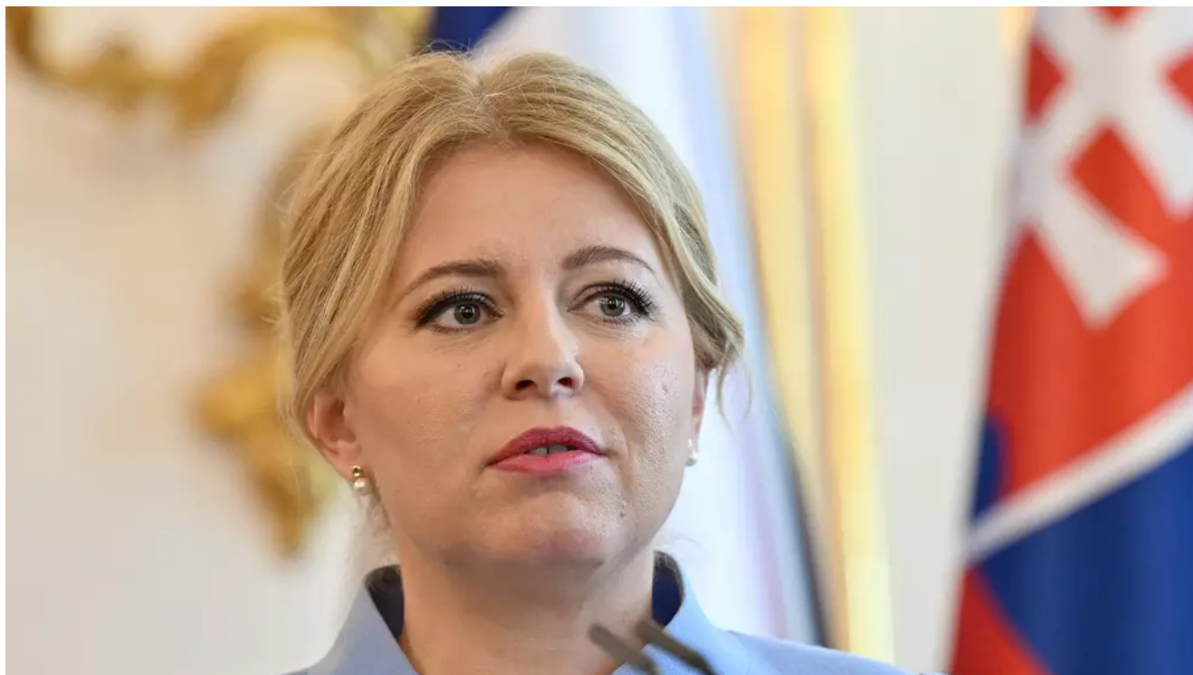
Slovenská prezidentka Zuzana Čaputová

Slovenská prezidentka Zuzana Čaputová odmítla jmenovat do funkce ministra životního prostředí Rudolfa Huliaka, který je kandidátem Slovenské národní strany (SNS). Hlava státu ve svém stanovisku zdůraznila, že prezidentka má svými rozhodnutími zabezpečovat řádný chod ústavních orgánů. K ostatním vládním nominacím Čaputová výhrady nemá.