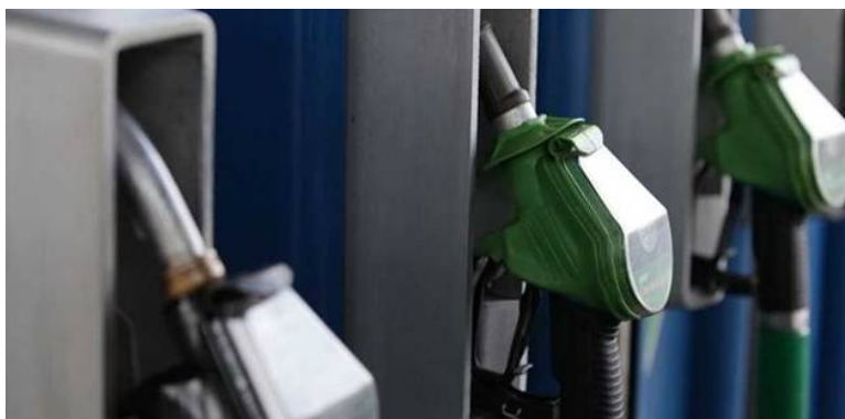
Popisek: Ilustrační foto.

Dění na Blízkém východě nevyhnutelně vyvolává otázky, jaké ceny benzínu a nafty mohou čeští řidiči v nejbližším období očekávat. „Záležet bude na tom, zda se konflikt mezi Hamásem a Izraelem rozšíří na větší území Blízkého východu, případně jestli se do něj zapojí Írán,