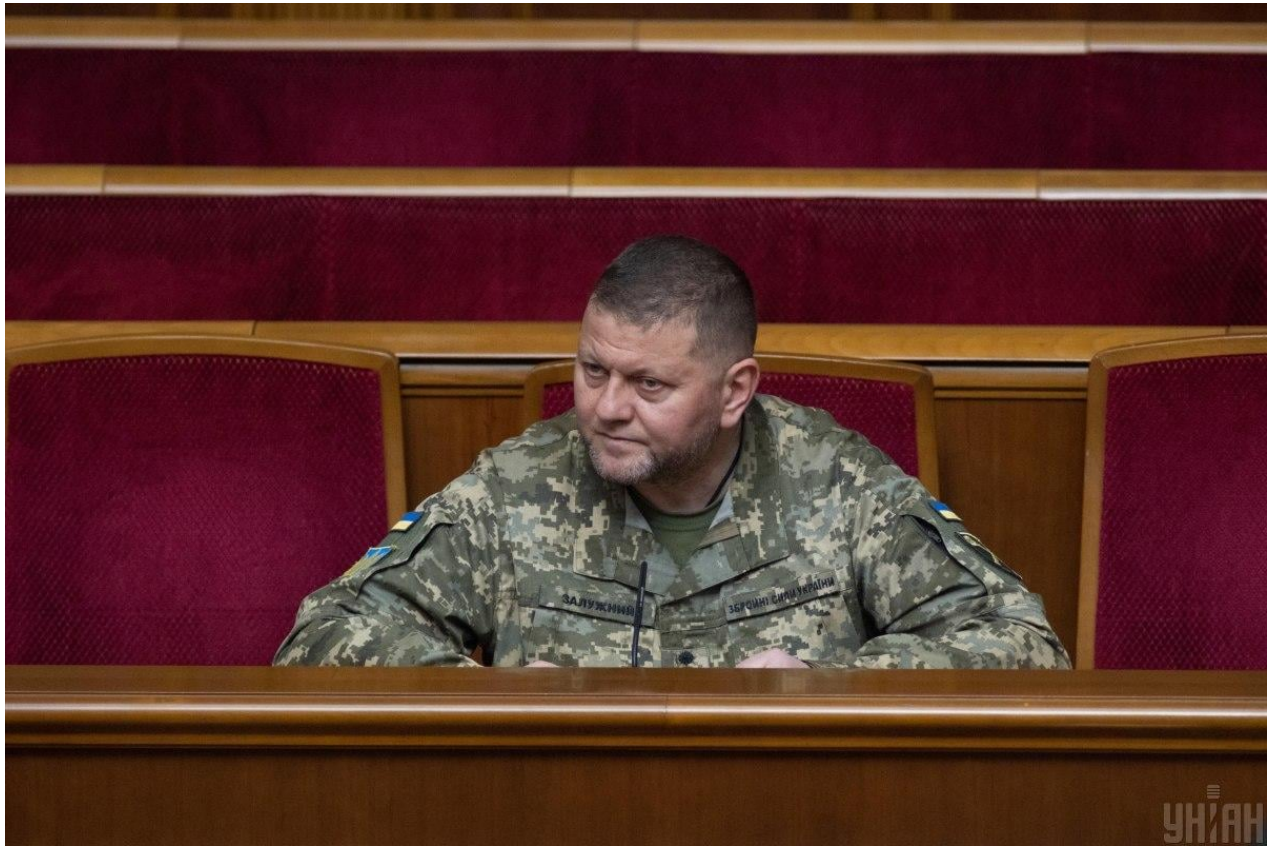
Валерий Залужный поговорил с Кристофером Каволи и Тони Радакиным

Главнокомандующий Вооруженными силами Украины, генерал Валерий Залужный провел встречу с Верховным главнокомандующим Объединенных вооруженных Сил НАТО в Европе, командующим ВС США в Европе генералом Кристофером Каволи и начальником Штаба обороны Великобритании адмиралом сэром Тони Радакиным. Обсудили наступательные операции Сил обороны Украины и их обеспечение.