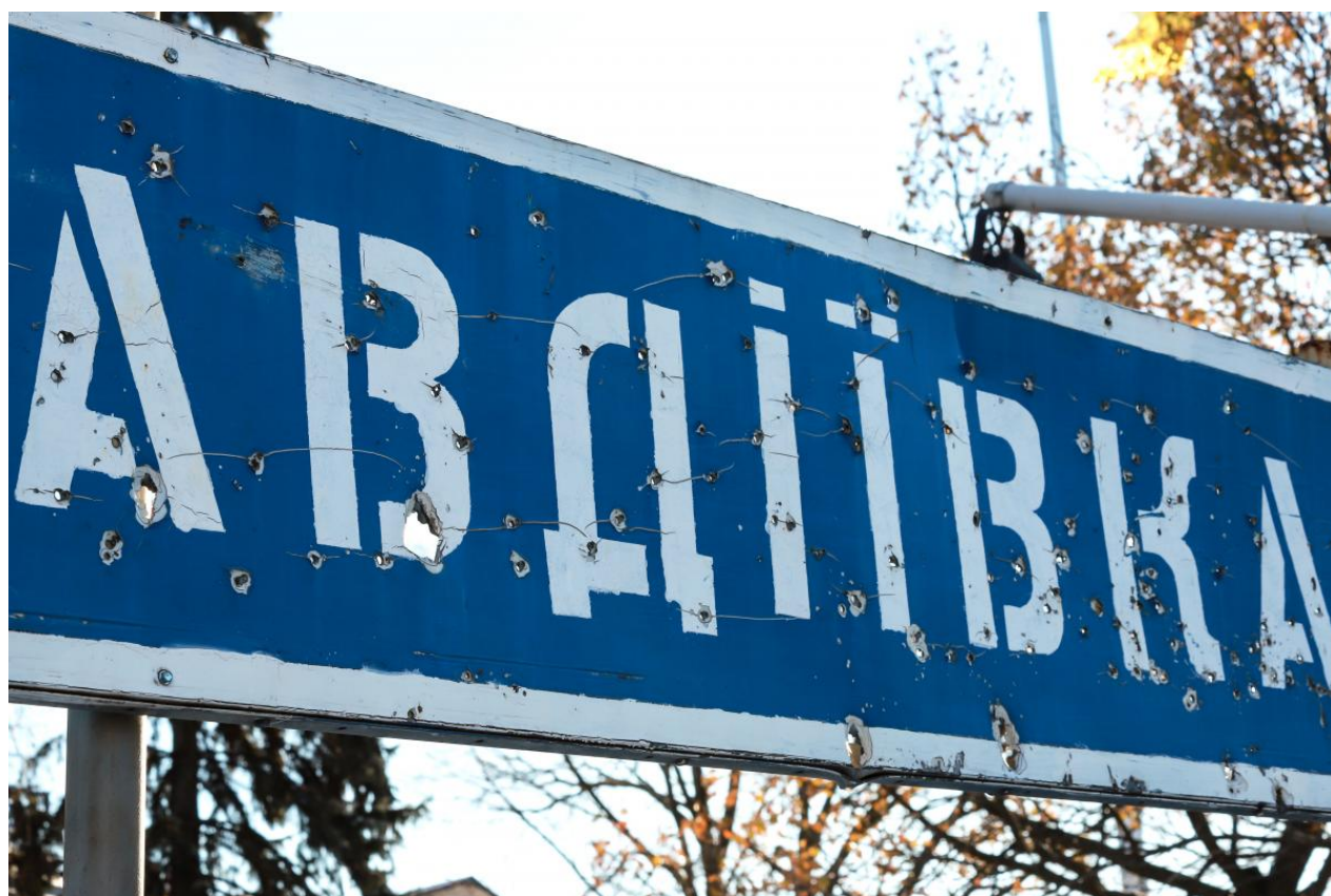
Voják popsal situaci v oblasti Avdeevka v Doněcké oblasti

Voják poznamenal, že nedávné vlny nepřátelských útoků přinesly „pro nás negativní výsledky“.