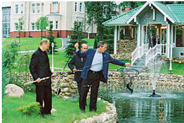
Vladimir Putin s americkým prezidentem Georgem W. Bushem při rybolovu (2002)

Státní rezidence na panství vznikla v první polovině 50. let 20. století na příkaz sovětského stranického vůdce G. M. Malenkova , který panství přestavěl podle návrhu své dcery architektky, ale nestihl v něm bydlet. Od roku 1955 je objekt využíván jako rezidence pro hosty oficiálních zahraničních vládních delegací a jako venkovská přijímací budova Ústředního výboru KSSS [5] .