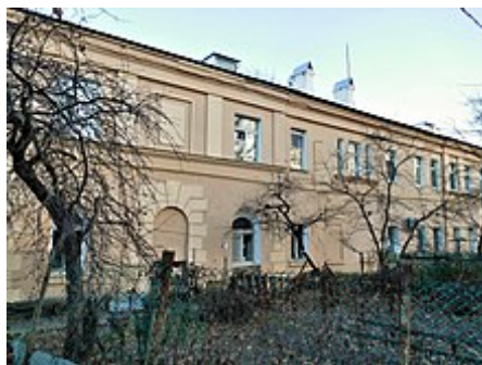
Bývalá stáj Novo-Ogarev, nyní obytná budova nejblíže k rezidenci, listopad 2018