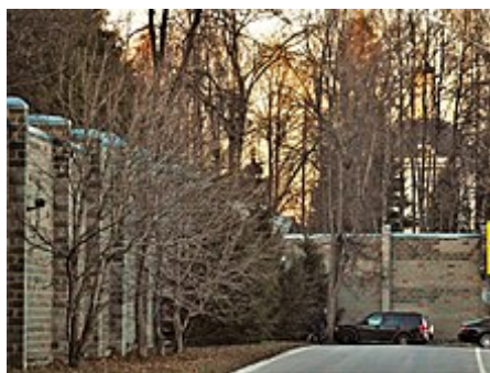
Šestimetrový kamenný plot a chrám na území rezidence

Neexistují žádné exkurze do státní rezidence. Ke kontrole zvenčí je přístupný pouze šestimetrový plot sídla [1].[2] .