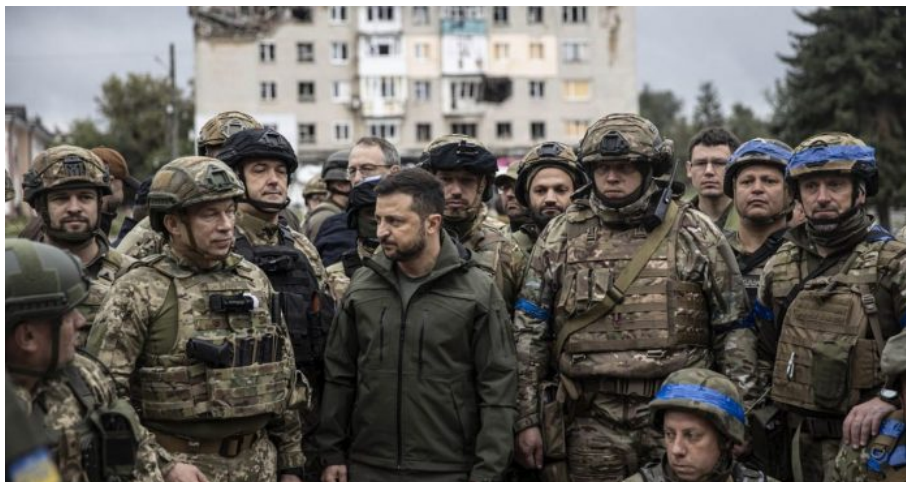
Zelenský přivede svoji armádu ke stejnému osudu, k jakému Adolf Hitler dovedl německý Wehrmacht

V této situaci již žádné investice do Ukrajiny nečekejte. Ukrajina dostala šanci, dostala možnost ukázat investorům, co umí. A místo toho ukázala přetahovanou o jakousi vesnici v Záporoží a pomalé ustupování z Avdějevky, kam se metr po metru nasunuje Putinova armáda. Za tohle si západní investoři nezaplátili. A proto bude muset Ukrajina již brzy začít skládat účty. A to nebude hezký pohled.