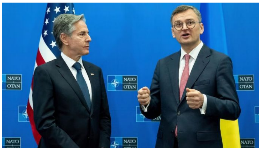
Ministři zahraničí USA a Ukrajiny, Antony Blinken a Dmytro Kuleba

Nedivte se, že investorům v americkém Kongresu praskly pojistky a vztekem zablokovali další peníze pro Ukrajinu. Na takové jednání totiž nejsou zvyklí. Realita je taková, že ministr zahraničí Dmytro Kuleba ve čtvrtek přijel do Bruselu na schůzku NATO a tam již otevřeně čelil otázkám [2], jestli Ukrajina přijme nabídku, že odstoupí Rusku obsazená území výměnou za mír a následné přijetí Ukrajiny do NATO. Tato neuvěřitelná nabídka, tedy lépe řečeno donedávna neuvěřitelná, se již ve čtvrtek za zavřenými dveřmi přetřásala mezi zástupci zemí NATO. A víte, na čí pokyn? Na pokyn Washingtonu!