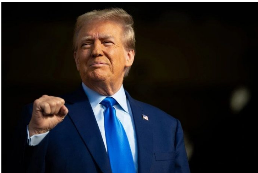
Donald Trump je v této chvíli posledním legitimním prezidentem USA

Jenže během jeho vlády se ukázalo, že právě Trump je tou rozbuškou pro globalisty, kterou hledali. Právě on je ztělesněním toho politika, který rozštěpí USA na dva nesmiřitelné tábory. A ukradení voleb Trumpovi v roce 2020 lze považovat za plán globalistů na natlakování amerického hrnce, který pokračuje sériemi obvinění Trumpa v soudních procesech připomínajících frašku a s tím spojené posilování Trumpových preferencí, které se nedají srovnat s nikým jiným v minulosti.