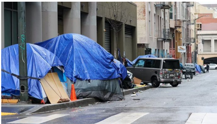
Ulice v San Franciscu s bezdomovci a jejich stany

Vyhrožování, že v ČR už léky nebudou jako dříve a budou jen na příděl [4]. Likvidace služeb občanům, zavírání poboček pošt v ČR stejně jako v USA [5]. Přestože ten proces v ČR zdaleka není tak daleko jako v Kalifornii, jde o stejný začátek destrukce republiky bandou diletantů a mafiánů, přičemž kauza Dozimetr je zdaleka ten nejmenší problém. Proto platí, že globalisté ty procesy spouští v různých rychlostech v různých zemích. A cesta Xi Jinpinga do Kalifornie je symbolická.