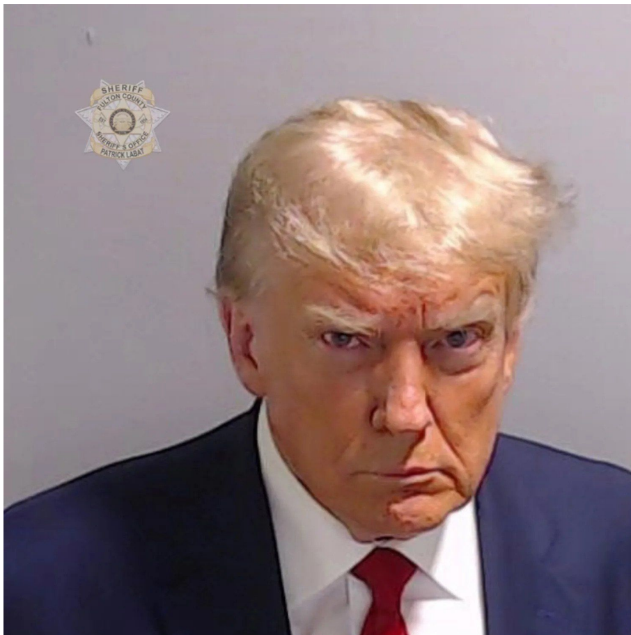
Donald Trump jako zarputilý mučedník na legendární fotografii z věznice v Georgii

Trump chce podle CNN využít tzv. Insurrection Act a označit chování některých států americké unie, které nedodržují ochranu federální americké hranice a pouští nelegální migranty do země, za zločin vzpoury, který by autorizoval prezidenta k rozmístění armády ve státech jako je Kalifornie s cílem zabránit nejen přílivu nelegálních migrantů z Mexika, ale především zabránit kalifornské vládě v jejich následné legalizaci.