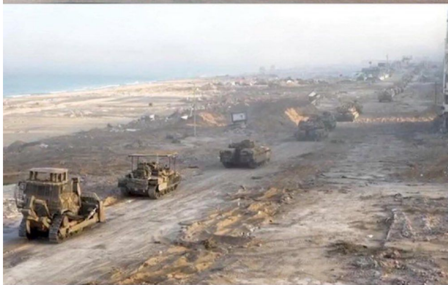
Izraelské demoliční jednotky začaly srovnávat severní část Gazy se zemí s cílem zabránit Palestincům v návratu do svých domovů. Sionistické zrůdy se chovají stejně jako Němci po zahájení útoku na Sovětský svaz, když takto srovnávali se zemí všechny vesnice a města

A Češi by to odmítali, protože celá Praha by měla být česká, zatímco přistěhovalci by tvrdili totéž o sobě a o tom, že je to jejich Praha, že před mnoha staletími v ní žili, že odkaz předků jim dává nárok na Prahu. A americká administrativa by jim to potvrdila a mezitím by českou armádu označila za teroristickou organizaci. Viděli byste v takovém vývoji spravedlnost pro český a moravský národ? Asi těžko. A přesně v této situaci jsou Palestinci, rozdělení do dvou lokalit, v Gaze a na Západním břehu. Všechno mezi tím ovládá okupant, tedy lépe řečeno "uprchlíci", které Palestina v roce 1948 s otevřenou náručí a bláhově přijala, když přijeli k Palestině v několika lodích po Středozemním moři z Evropy.