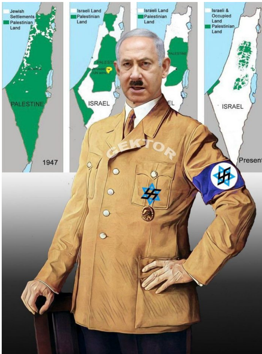
Vůdce sionistického Izraele

Cítí se oprávněni k bombardování nemocnic a porodnic v Gaze. Představte si, kdyby totéž dělala Ruská armáda na Ukrajině, kolik řevu a trestních tribunálů v Haagu by kvůli tomu bylo ustanoveno, ale když to dělají sionisté a vyhlazují Palestince, kolektivní Západ buď mlčí anebo ti nejaktivnější tento proces otevřeně podporují. Nelze se potom divit, že ti, kteří nacismus zažili, jsou na jeho projevy citliví a hned je identifikují. Přeživší z koncentračních táborů dobře vycítí nacismus a procesy genocidy a etnického čištění, a proto odporují Izraeli a podporují Palestince, protože to již jednou v minulosti zažili.