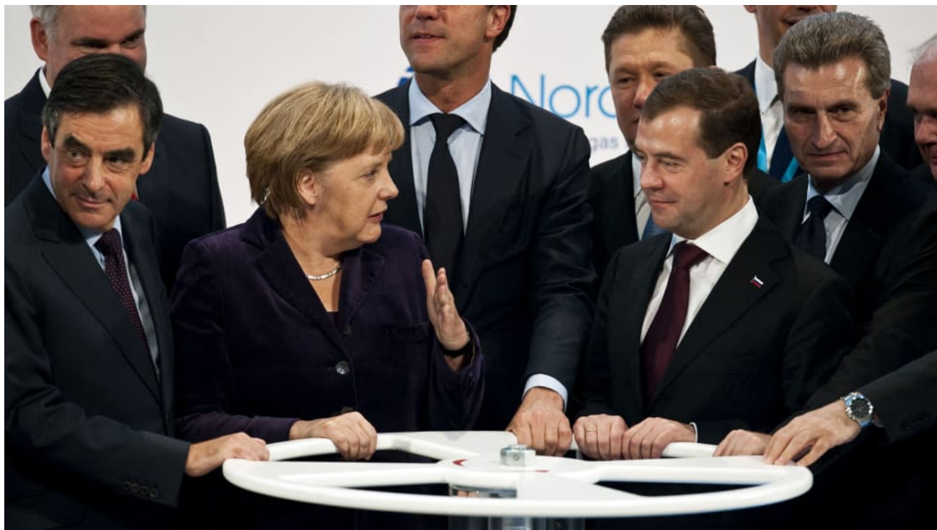
Merkelová s tehdejší ruským prezidentem Dmitrijem Medveděvem při slavnostním otevření plynovodu Nord Stream

Bývalý kancléř o tom dodnes nechce nic vědět. V rozhovoru pro „Zeit“ není od Merkelové ani náznak sebekritiky s prostým textem.