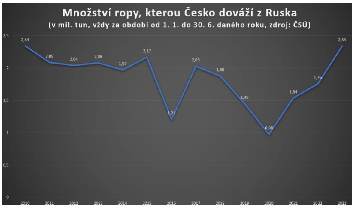
Dovoz ruské ropy do Česka za první půlrok 2010-2023