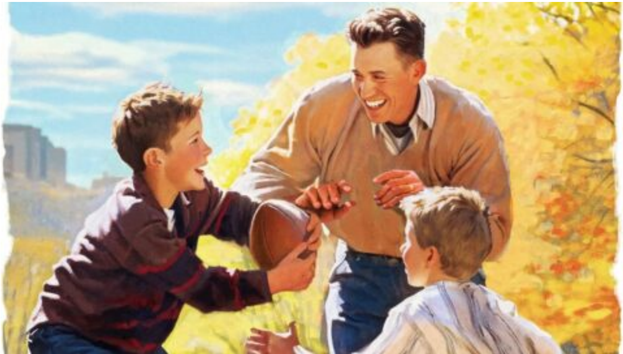
Synův první hrdina, dceřina první láska: Chvála dobrých otců