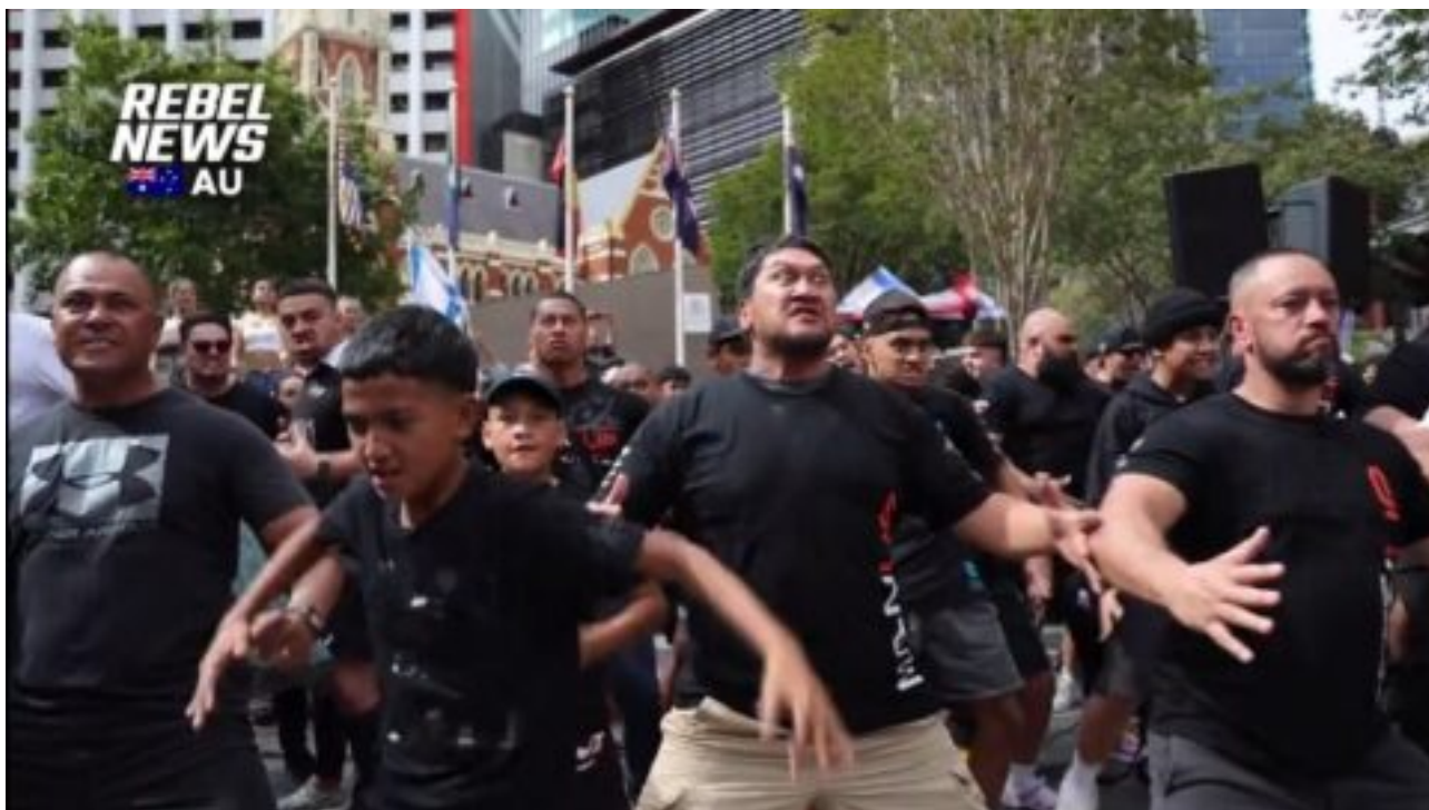
Husarský kousek: Maorové svým tancem vyhnali propalestinské demonstranty jinam