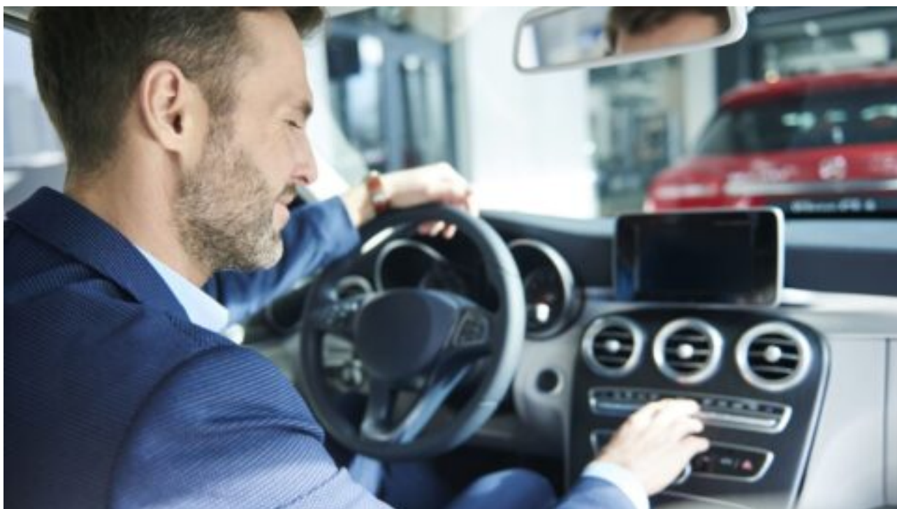
Od července 2024 bude „nejotravnější asistent“ povinnou výbavou nových aut