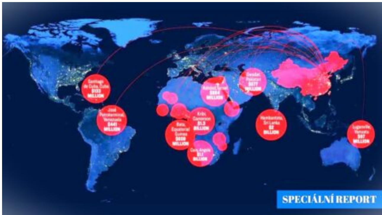
Do nitra globální vojenské expanze Číny