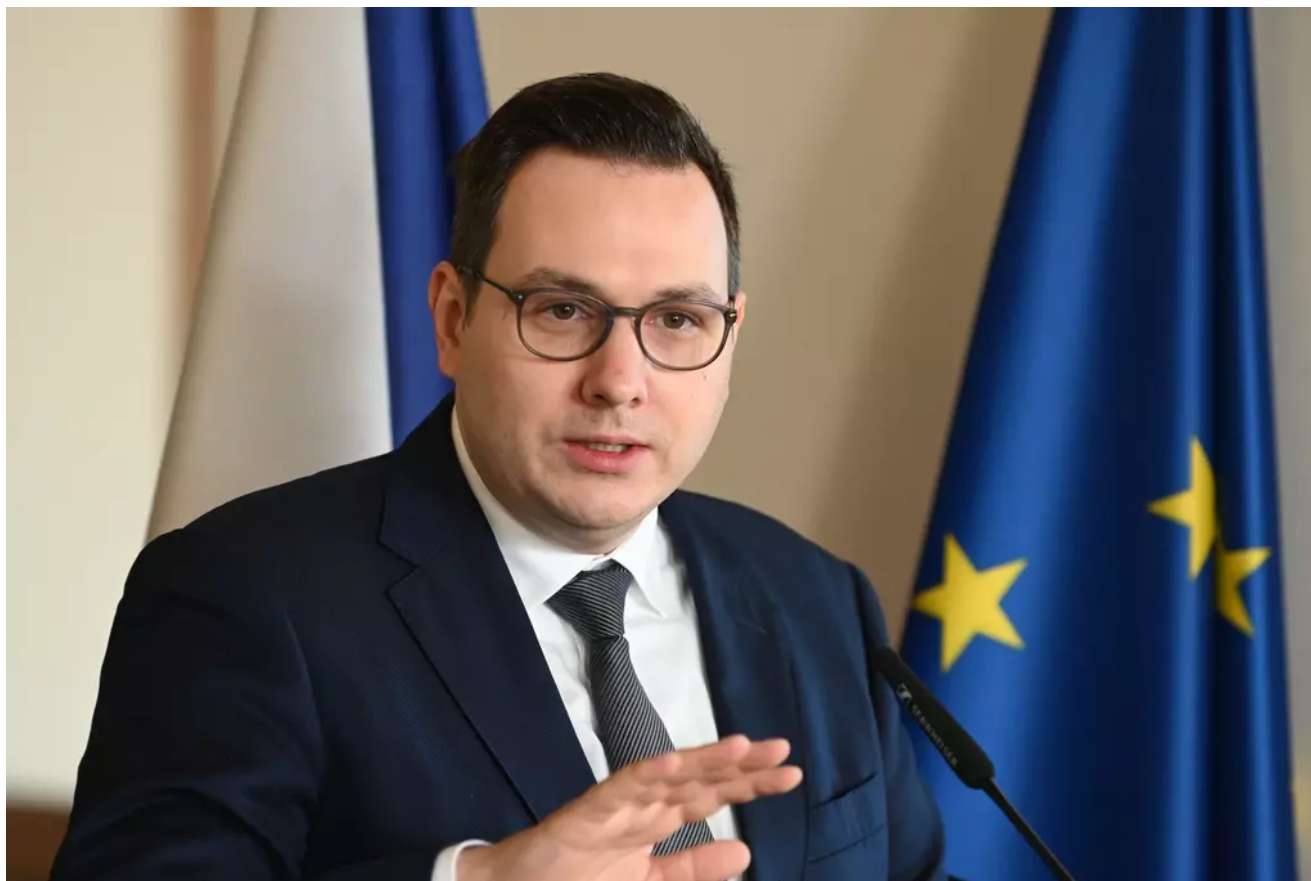
Šéf české diplomacie Jan Lipavský