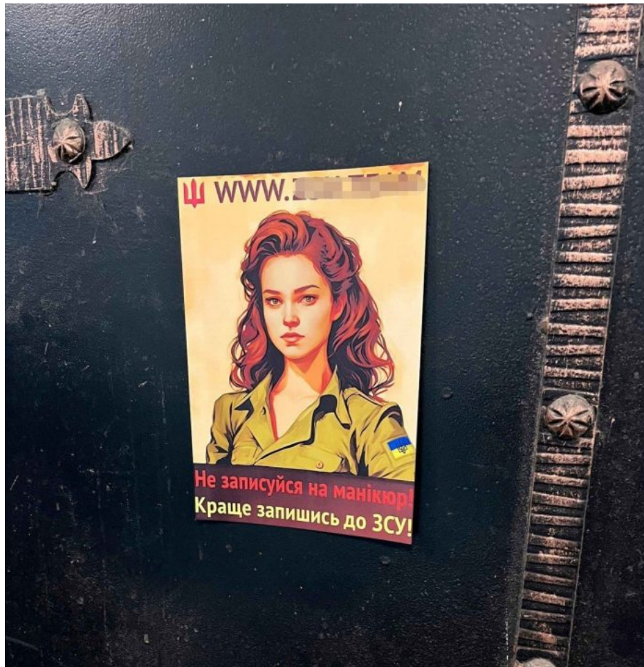
Rekrutační plakát pro ženy: “Nezapisuj se na manikúru. Raději se zapiš do armády!”

Při neúspěšném pokusu pochválit ukrajinský systém protivzdušné obrany vrchní poradce Alexej Arestovič odhalil, že útok na civilní rezidenční oblast v Dněpru způsobily ukrajinské síly. Podle něj kyjevská obrana střelila na ruské rakety v Dněpru, což vedlo jako vedlejší efekt k incidentu a jedna z raket zamířila proti civilním budovám v oblasti.