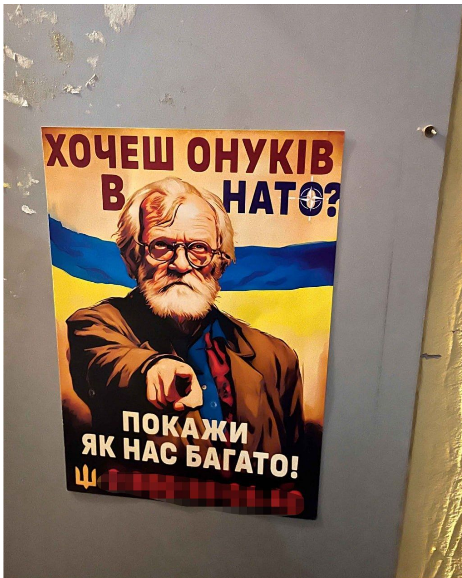
Rekrutační plakát pro seniory: "Chceš mít vnoučata v NATO? Ukaž, kolik nás je!"

Právě teď, kdy americký Senát v noci na čtvrtek neschválil balík finanční pomoci pro Ukrajinu. Republikáni podmiňují podporu balíku velkou migrační reformou v USA, se kterou ale Joe Biden nesouhlasí, protože republikánský návrh je prý příliš tvrdý a usiluje o zastavení migrace, zatímco Biden chce jen její zmírnění, zmenšení čísel migrantů.