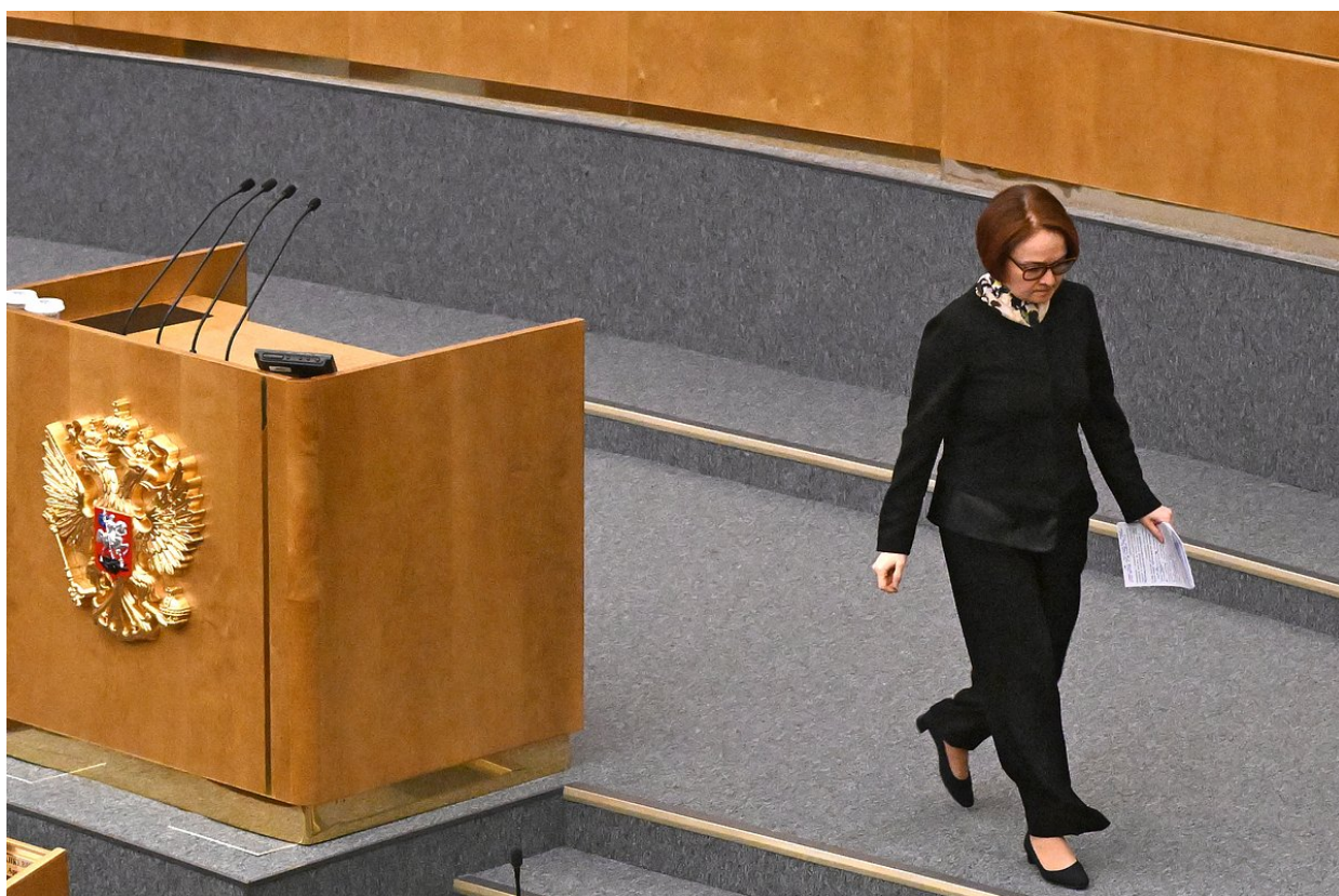
Elvira Nabiullina na zasedání Státní dumy v dubnu 2023

Elvira Nabiullina se stala „torpédoborcem roku“