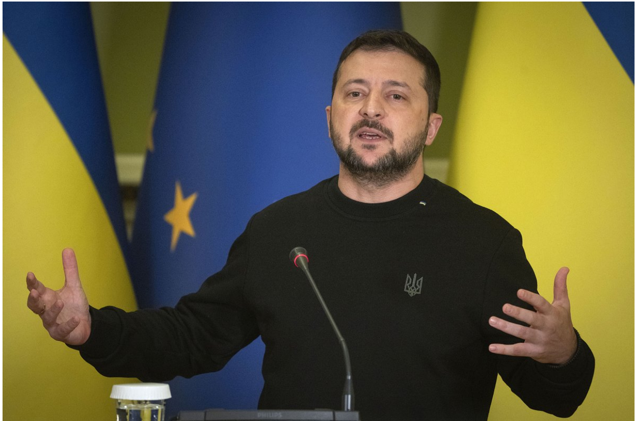
Vladimír Zelenský

„Hlavním snílkem“ roku 2023 byl ukrajinský prezident Vladimir Zelenskyj. Politico přirovnalo ukrajinského vůdce k Winstonu Churchillovi , Martinu Lutheru Kingovi Jr. a Nelsonu Mandelovi a udělilo mu titul „maratónský běžec“.