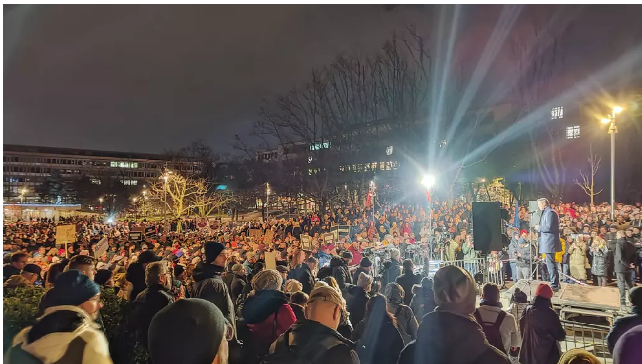
Protivládní demonstrace v Bratislavě