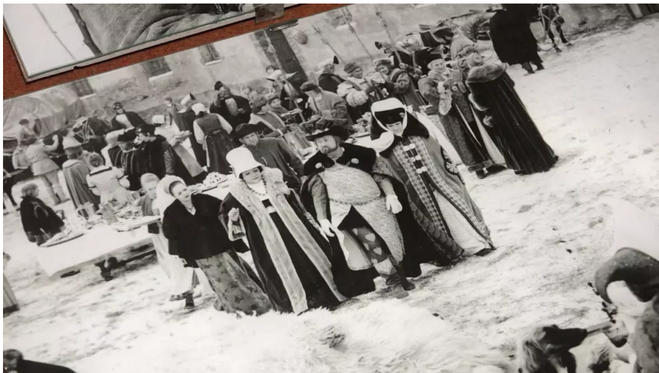
Na výstavě jsou k vidění fotky z natáčení.

Při natáčení v Německu si poradili třeba směsí rozemletých rybích kostí a dalších látek, z takového umělého sněhu se ale nesl nelibý zápach. Používali také polystyren rozemletý na kuličky, které tu lidé na trávníku nacházeli ještě několik let poté. Střechy zase stříkali vápnem. Nakonec se nadílky přírodního sněhu přece jen dočkali...