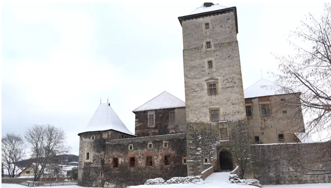
Vodní hrad Švihov

Filmaři udělali z nádvoří a přilehlých stavení statek, ve kterém Popelka žila a musela snášet ústrky ze strany macechy a nevlastní sestry Dory.