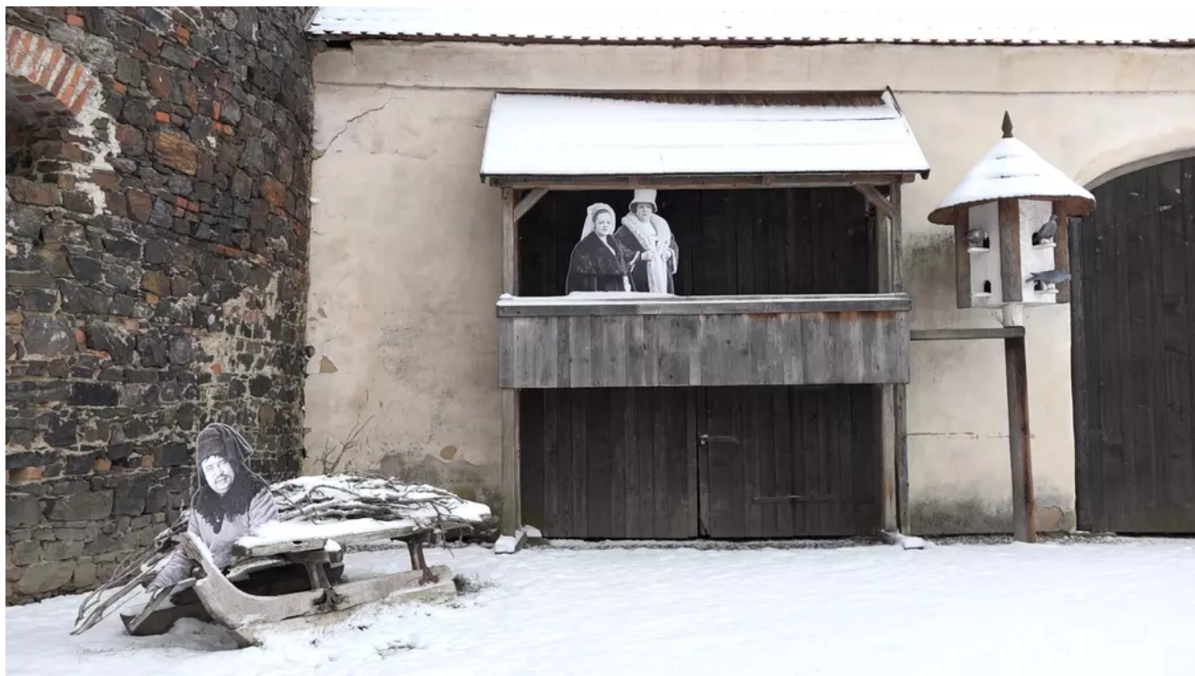
Na Švihov umístili filmaři domov Popelky.