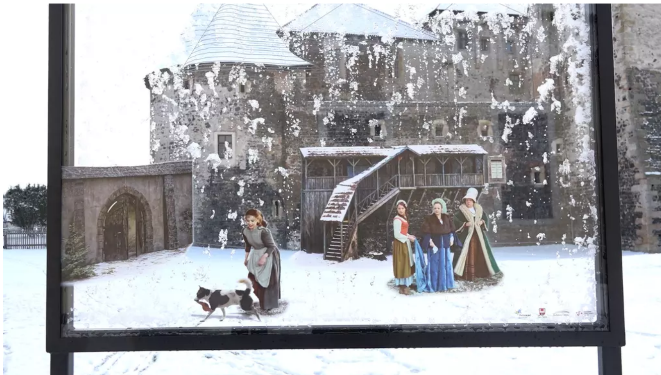
Jeden z fotobodů

Místo nechal upravit podle svých potřeb a nádvoří doplnil řadou kulis. Třeba ke zmiňované kamenné zdi přistavěl pavlač jako vstup do stavení. Vedle umístil bránu, kterou sem vjíždí na úvod snímku královská delegace, na dvůr zase přidal studnu či holubník na tyči.