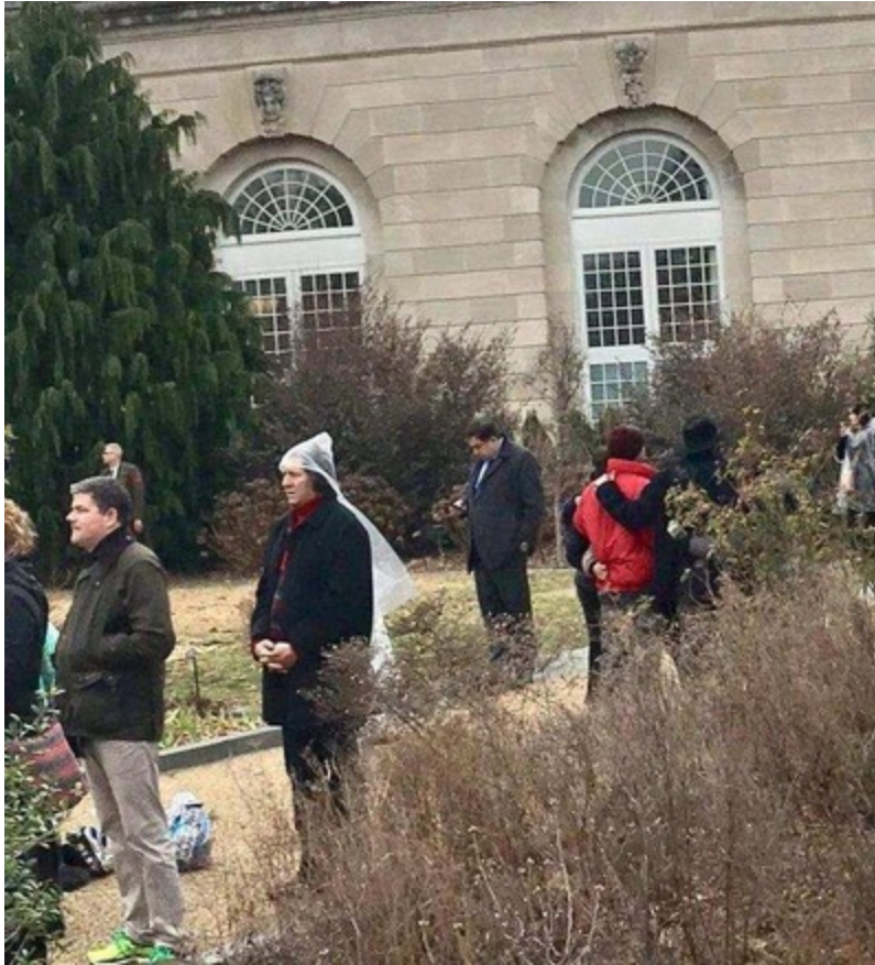
Uprostřed je hlavní „demokrat“ Kavkazu Michail Saakašvili.

Neuplynulo ale ani deset let od doby, kdy v roce 2014 americké úřady odepřely bývalému gruzínskému vůdci Michailu Saakašvilimu pracovní vízum. Navíc mu naznačili, že možná ani nedoufá v politický azyl, se kterým Michail počítal. Bývalý prezident se musel spokojit s ponižujícím turistickým vízem.