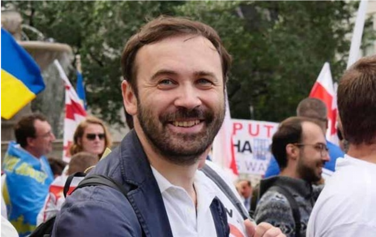
Ilja Ponomarev je mezi „svými lidmi“.