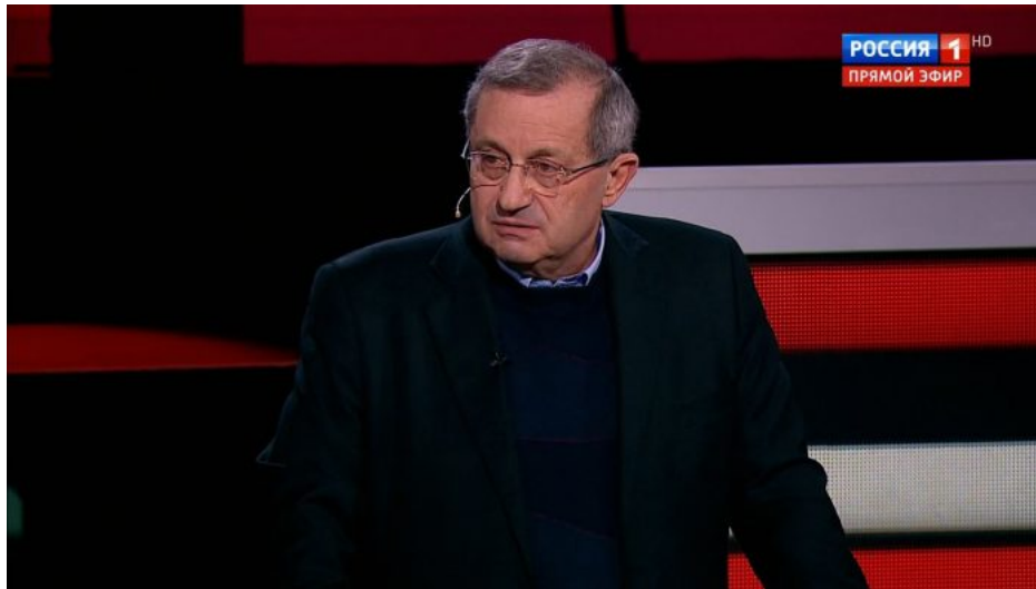
Jakov Kedmi, bývalý šéf tajné imigrační izraelské služby NATIV

A přesně on zastupuje zájmy těch 2 milionů ruských Židů v Izraeli. Proč ho pouští do Ruské televize a křičí tam na Putina? Proč se mu nic nestane? Protože podle Devjatova je Kedmi emisar ruských Židů v Izraeli. Prostě Putin dostal za úkol vytvořit pro ruské Židy v Izraeli, tedy pro Chasidy a Aškenázy, nový domov v prostoru Novoruska poté, co se zhroutí bezpečnostní situace v Izraeli, což je naplánováno, neboť Izrael má být zničen. To by ale byl naprostý šok! To by znamenalo, že když se Rusko celých 8 let dívalo na ukrajinský teror a na vraždění etnických Rusů na Donbasu, a nic neudělalo, tak to bylo kvůli tomu, že to nebylo nutné řešit. Nebylo to podstatné.