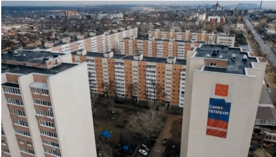
Rusko obnovuje Mariupol závratným tempem