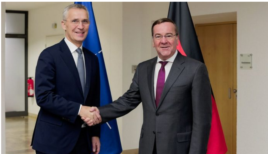
Generální tajemník NATO Jens Stoltenberg a německý ministr obrany Boris Pistorius

Ekonomická válka proti Rusku již běží, EU uvaluje sankce za sankcemi, před pár dny došlo ke schválení již 12. balíku sankcí EU, zatímco USA nic! Americký kongres a ani Bílý dům žádné další sankce nevaluje na Rusko. Nikomu to nepřijde zvláštní? A jestli to bude válka ekonomická, nebo válka plně rozvinutá se vším všudy, to je vlastně jedno. Válka totiž Evropu oslabí a Američané posílí kontrolu a vliv nad Evropou. Není proto divu, že Berlín právě oznámil [3], že spolková vláda uvažuje, že by došlo k obnovení branné povinnosti a základní vojenské služby. Je to logické, protože Američané netouží o přímý střet s Ruskem, ale chtějí, aby se Evropská unie střetla s Rusy v Evropě v další válce.