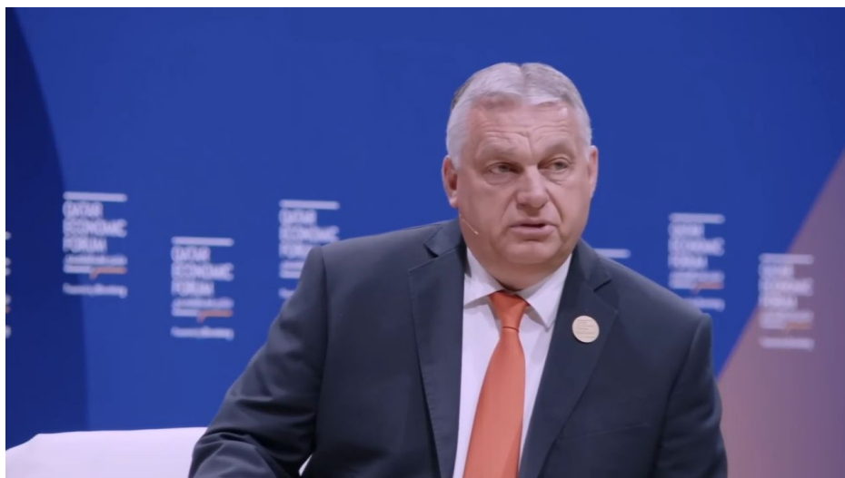
Viktor Orbán, premiér Maďarska

A když Orbán a Fico sabotují financování a vyzbrojování Ukrajiny, jednájí tím pádem v rozporu s klíčovými principy a hodnotami EU. Zatím se prý uvažuje o odebrání hlasovacích práv jen Maďarsku, které se má stát exemplárním a varovným příkladem pro ostatní "zlobivé" země EU. Pokud by Robert Fico pokračoval ve svých postojích a blokoval by vojenskou a finanční pomoc Ukrajině určenou pro vedení války, potom by Evropská komise odebrala hlasovací práva i Slovensku.