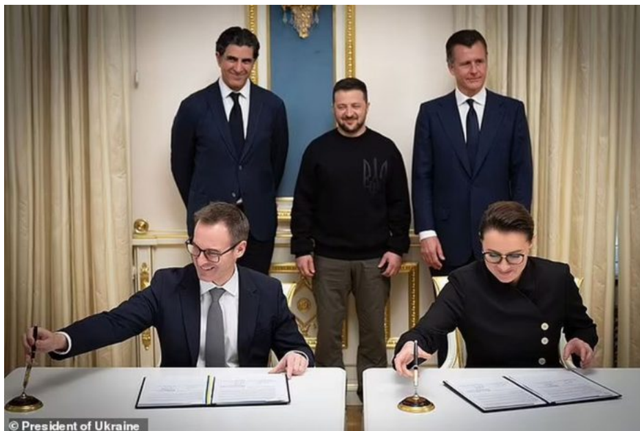
Ředitel BlackRock Larry Fink (sedící vlevo) podepisuje v New Yorku memorandum s Ukrajinou o spolupráci na vzniku Ukrajinského fondu rozvoje (UDF)

Rozdíl mezi public a private equity je přitom zcela zásadní. Pokud Zelenský na tajné schůzce chce do obnovy Ukrajiny zahrnout soukromý kapitál, bude Ukrajina muset za úvěry a investice ručit přímo kolaterálem, nikoliv veřejnými ručiteli, na rozdíl od public equity investičního rámce, jaký jsme dosud viděli u americké vlády a také u Evropské komise, která se dosud zaručovala svými členy za ručení úvěrů, které Ukrajině poskytoval FED v USA a ECB v Evropské unii.