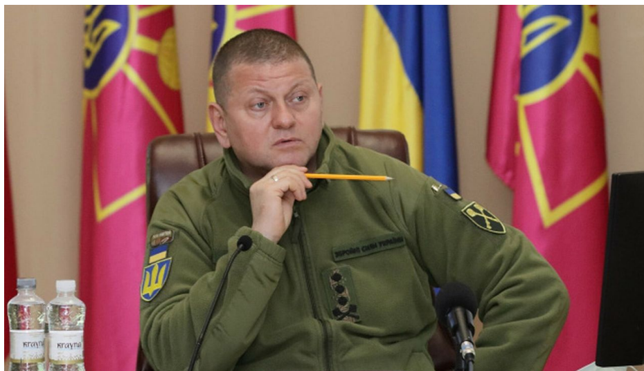
Valerij Zalužný, náčelník generálního štábu AFU

Proto generál Tymošenko na tom uniklém záznamu říká, že vítězství se může na frontě dosáhnout jen tehdy, pokud se do vedení a řízení bojových operací nebudou montovat politici s jejich businessy, čímž Tymošenko myslel tu smlouvu Zelenského prezidentského úřadu s americkou investiční firmou BlackRock, která má financovat obnovu Ukrajiny a právě BlackRock tlačí Zelenského do nesplnitelných termínů.