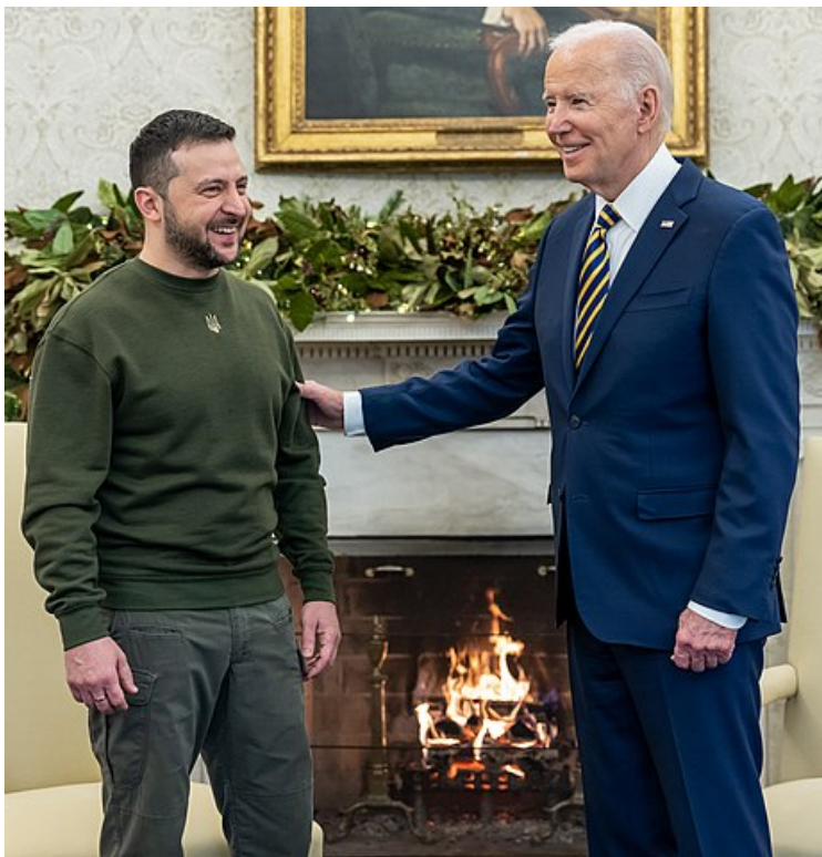
Volodymyr Zelenskyj s americkým prezidentem Joem Bidenem v Oválné pracovně Bílého domu, 21. prosince 2022.

I v kontextu výše uvedených omezení jsou Ukrajinci zatlačováni zpět a ukrajinská armáda by se mohla kdykoli v blízké budoucnosti zhroutit. Rusko pravděpodobně nepřijme dohodu o příměří bez politického urovnání, protože Putin by doma ztratil své postavení. Zelenskyj neuzavře žádnou politickou dohodu s Ruskem.