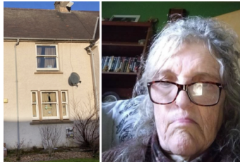
Strach z oxidu uhelnatého po dvojité smrti