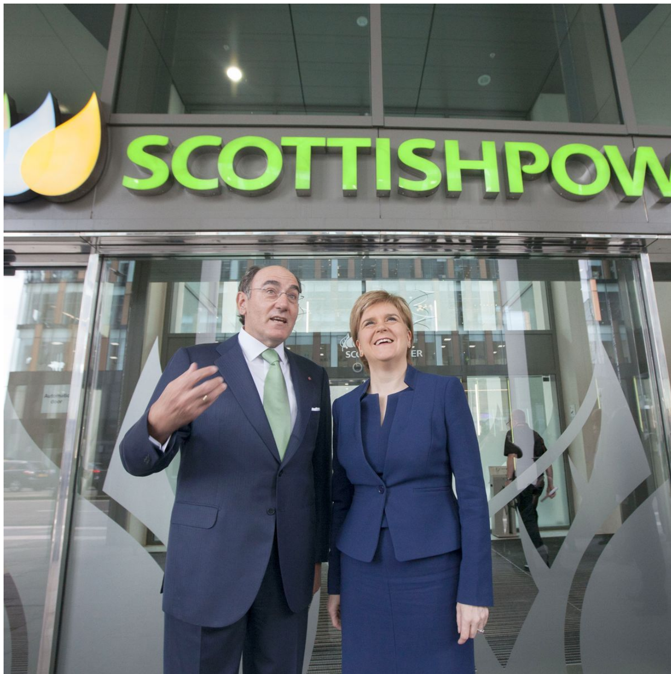
První ministryně Nicola Sturgeon s Ignaciem Galanem, generálním ředitelem Scottish Power

"Ať už jsou důvody jakékoli, nutnost používat dieselové generátory k odmrazování vadných turbín je ekologické šílenství. Tato úroveň nepoctivosti zasahuje do samotného jádra SNP a Zelené vlády, kde se jejich rétorika o čisté nule velmi liší od reality."