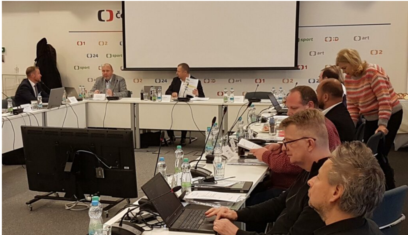
Jednání rady České televize dne 13. prosince 2023