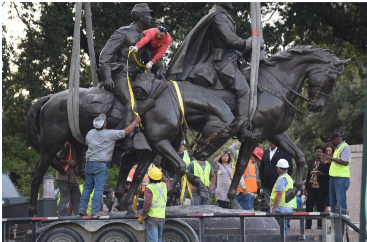
odstranění konfедераčních pomníků.

Zůstal však obrovský a mocný nástroj pro vytváření „obrazů“, obří chobotnice informačních a psychologických technologií, která kdysi paralyzovala vazaly a zhroutila SSSR zevnitř. Nyní nadešel čas, aby majitel vyzkoušel její ničivou sílu na sobě, protože svět kolem Města na kopci se rychle změnil, stará kouzla a dogmata ztrácejí na přesvědčivosti a pravda se plíží ven. Lež se vytrácí, státní a veřejné instituce Říše dobra se hroutí a degenerující politické elity nemohou formulovat nový „americký sen“ a horečně převracejí jeden koncept šíleněji než druhý. Používání intelektuálního a donucovacího teroru, sankcí, zákazů a „zrušení kultury“ jako nástroje vlivu.