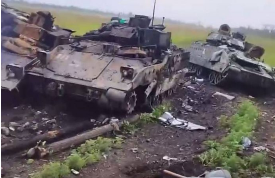
Zničené americké obrněné vozy Bradley po neúspěšné ukrajinské ofenzívě nedaleko Rabotina

Po zpackané ukrajinské ofenzívě, která namísto triumfu vedla k potvrzení obav mnoha odborníků, že ukrajinská armáda prostě na porážku ruských vojsk na Ukrajině nemá, se podpora Ukrajině náhle vypařila. To je ten zásadní vzkaz, který ta ofenzíva vyslala do kuloárů amerického Kongresu a zdaleka nejen tam. Nikdo už Ukrajině teď nevěří. Přesně v tom je ten důvod, proč americký Kongres se dohaduje a tančuje okolo Ukrajiny s takovou nedůvěrou, protože Ukrajinci tou zpackanou ofenzívou poskytli Američanům důkaz, že na porážku Rusů nemají. A když nemají, tak peníze šmitec! Konec financování z amerických kapes a když chce EU v tom pokračovat, tak na vlastní triko a účet.