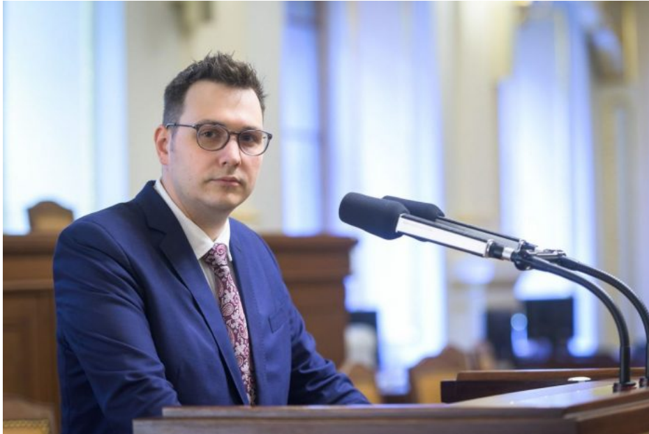
Jan Lipavský, ministr zahraničí ČR

Lipavského zamíni to ani neskrývá, že Ukrajincům tyto útoky de facto schvaluje. Jakmile by Rusko udeřilo na civilní cíle prvoplánově na Ukrajině, ne jako kolaterální škoda způsobená sestřelem rakety, ale jako prvoplánový útok proti civilním bytovkám, tak v tom okamžiku by Kyjev i NATO měly veřejnou záminku a objednávku na vyslání mírových sborů vybraných a ochotných členských zemí NATO na Ukrajinu.