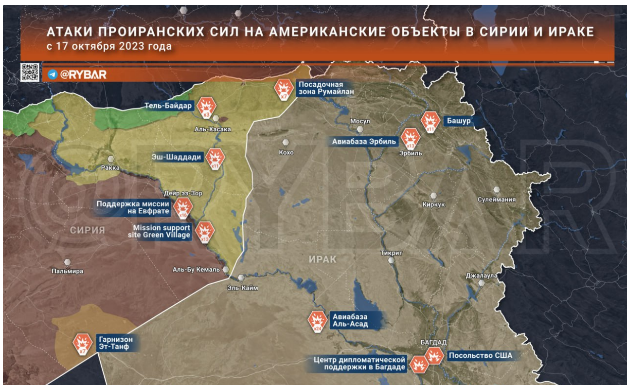
Mapa 108 útoků drony a raketami proti USA!

Logika Putina, kterého stravují emoce, je pro analytiku CIA takřka nemožné si představit. To je naprostá změna chování! Pokud ji Putin, který chladnokrevně myslí na celá léta dopředu, najednou veřejně publikuje své rozhořčené emoce, je to svým způsobem umocněný chladnokrevný vzkaz USA, a dalším zbrojřům Ukrajiny – Pozor!!! Mohl bych se naštvat!!!