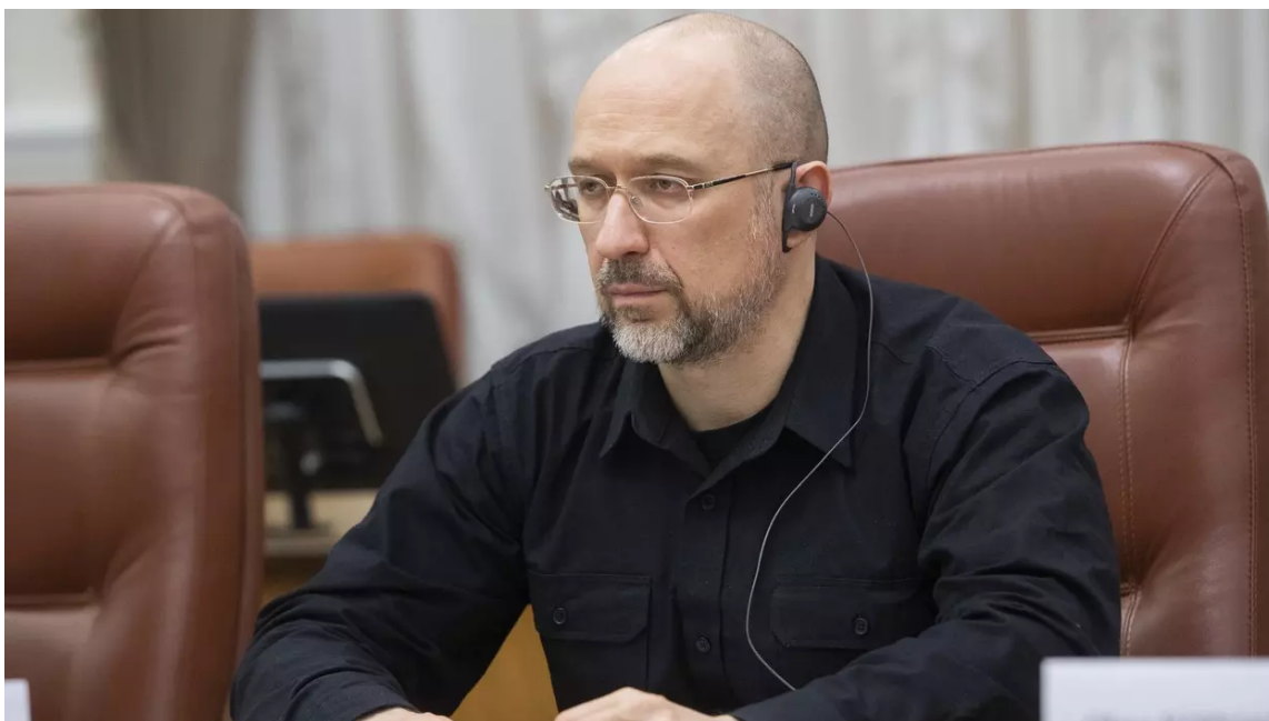
Ukrajinský premiér Denys Šmyhal

Ukrajina bude letos potřebovat asi 37 miliard dolarů (zhruba 837 miliard korun) vnější pomoci, což je méně než v roce 2023, řekl ve středu na jednání vlády ukrajinský premiér Denys Šmyhal. Loni podle něj Ukrajina dostala ze zahraničí pomoc ve výši 42,6 miliardy dolarů (962,7 miliardy korun).