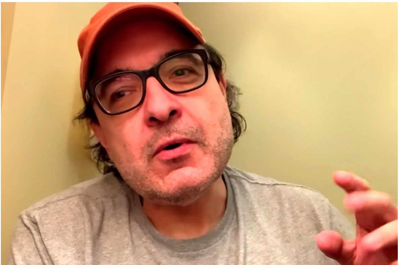
Gonzalo Lira (*1968 – †2024)

Lirova smrt následovala po osmiměsíčním věznění na základě obvinění z “ospravedlňování ruských vojenských akcí na Ukrajině“ , což vyvolalo mezinárodní kontroverze a vyvolalo otázky týkající se svobody projevu a lidských práv v době války. Gonzalo Lira se v roce 2022 proslavil jako hlasitý kritik toho, co vnímal jako rostoucí autoritářství na Ukrajině.