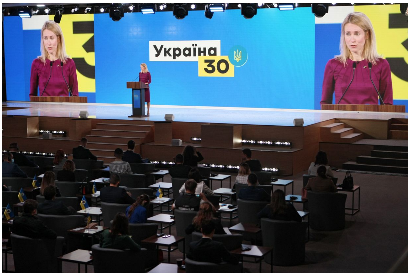
Předsedkyně estonské vlády Kaja Kallasová vystoupila na Ukrajině 30. Digitalizační fórum v Kyjevě v květnu 2021.

mnohem větší než rozpočty silně nafouknutého ruského. A když si jen jednoduše spočítáte, kolik peněz Rusko měsíčně utratí na válku, je to zhruba 5,3 miliardy eur. Ale když si vezmete kombinované rozpočty a těchto 0,25 % HDP všech těch koaličních zemí Ramstein, pak by to bylo 120 miliard. To by definitivně otočilo vývoj ve prospěch Ukrajiny. Ale pak je samozřejmě další otázkou konkrétní vojenské vybavení a tam říkám, že cokoliv máte, co by mohlo Ukrajině pomoci k vítězství, byste měli dát. Myslím, kdo to má, ale je na těch zemích, jak se nakonec rozhodnou.