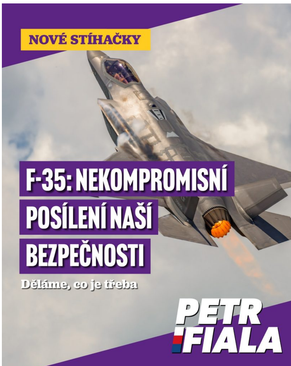
Propagandistický logotyp ze sociálního profilu Petra Fialy

Pokud se ptáte, kde na ty stíhačky vezme česká vláda peníze, je to snadné. Jedná se o peníze, které vláda získá na úkor českých důchodců, kterým vloni Fialova vláda zkrátila valorizace penzí, a to o 1 000 Kč v průměru. Česká vláda má první stroje F-35 obdržet v roce 2030, ale shodou okolností právě do roku 2030 ušetří české vlády na snížených valorizacích důchodů celých 250 miliard korun!