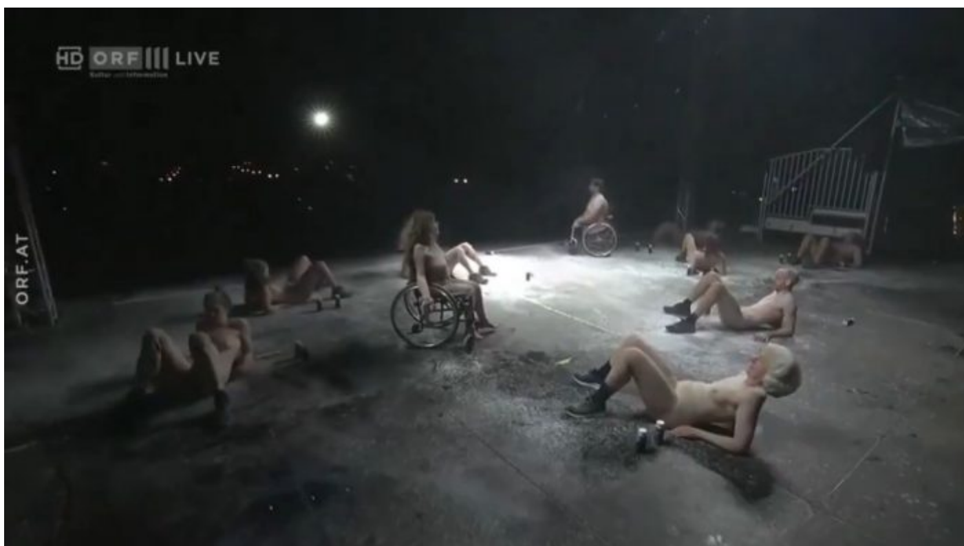
Obraz Pandemonia, zmrzačených vojáků na kolečkových křeslech a padlých lidí poté, co Lucifer zvítězil v boji o Zemi

Proč malým a normálním dětem ukazuje oplzlosti na hraně porna, jak si nazí lidé na sebe sypou jakýsi prášek nebo popel z lahviček? Proč se národy ženou do války s jadernou velmocí na východě? Co bude na konci střetu jaderných velmocí? Spálená Země a jenom 100 milionů lidí přežije! Globalistický nepřítel se tak snaží naplnit proroctví ze Satanské Bible a vytvořit na povrchu planety obraz Pandemonia, tedy pozemského hlavního města Satanova nového impéria na Zemi.