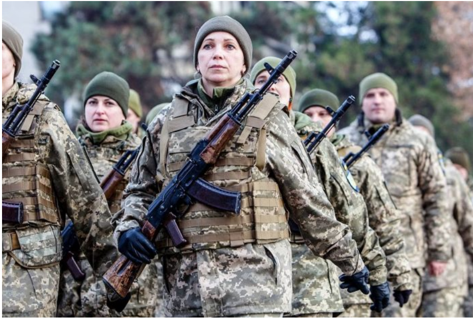
AFU začala koncem minulého roku odvádět už i ženy

Kromě toho, jak informovalo ukrajinské ministerstvo obrany, návrh nepočítá s odvodem zdravotně postižených osob a ponechává beze změny právo stěhovat se bez povolení vojenského odvodního úřadu. Proti dokumentu se postavilo ukrajinské sdružení "Evropská podnikatelská asociace" a požádalo, aby nebyl v této podobě přijat.