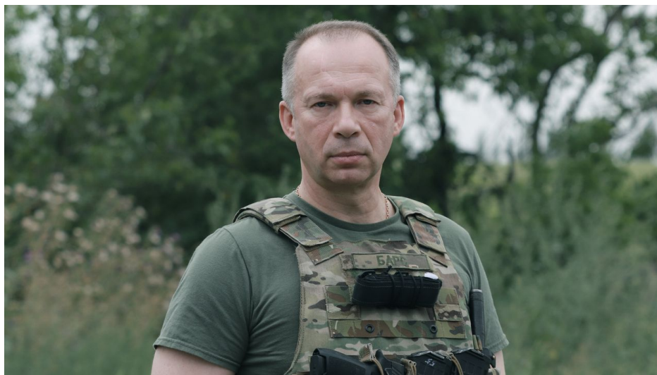
Oleksandr Syrský, nový vrchní velitel AFU

V této chvíli může jít o jmenování tzv. direktivním rozkazem, bez souhlasu samotného Syrského, který s tím samozřejmě nemůže nic dělat a musí to přijmout. Zelenský neměl na výběr, protože není z čeho vybírat. Druhou možností byl Kyrylo Budanov, šéf ukrajinské vojenské rozvědky GUR, která ale má mezi ukrajinskými vojáky opravdu mizernou pověst. Zelenský tak neměl na výběr, do pozice určil Syrského.