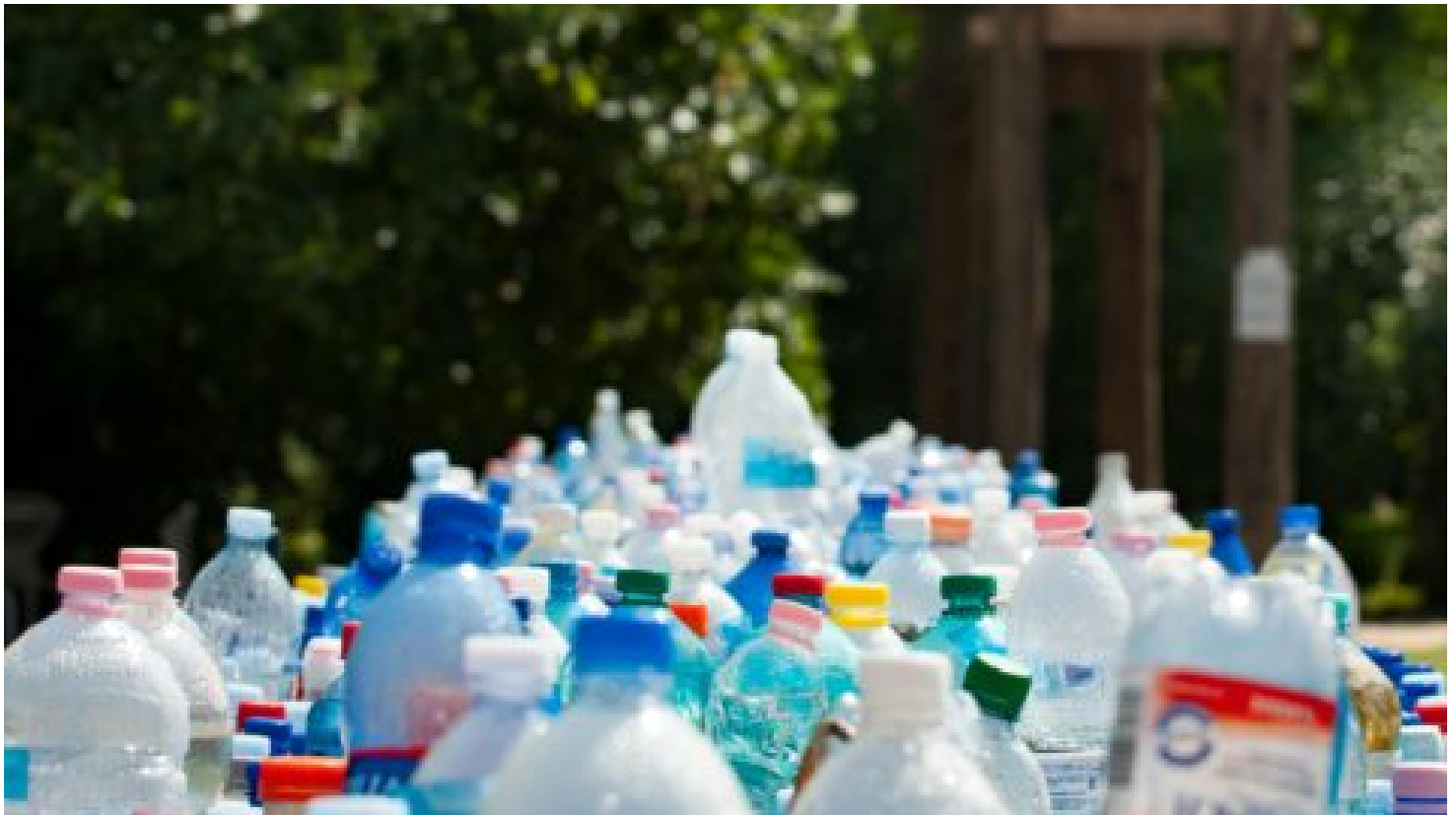
Na co ještě čekáme? Zkušenosti se zálohováním obalů na Slovensku