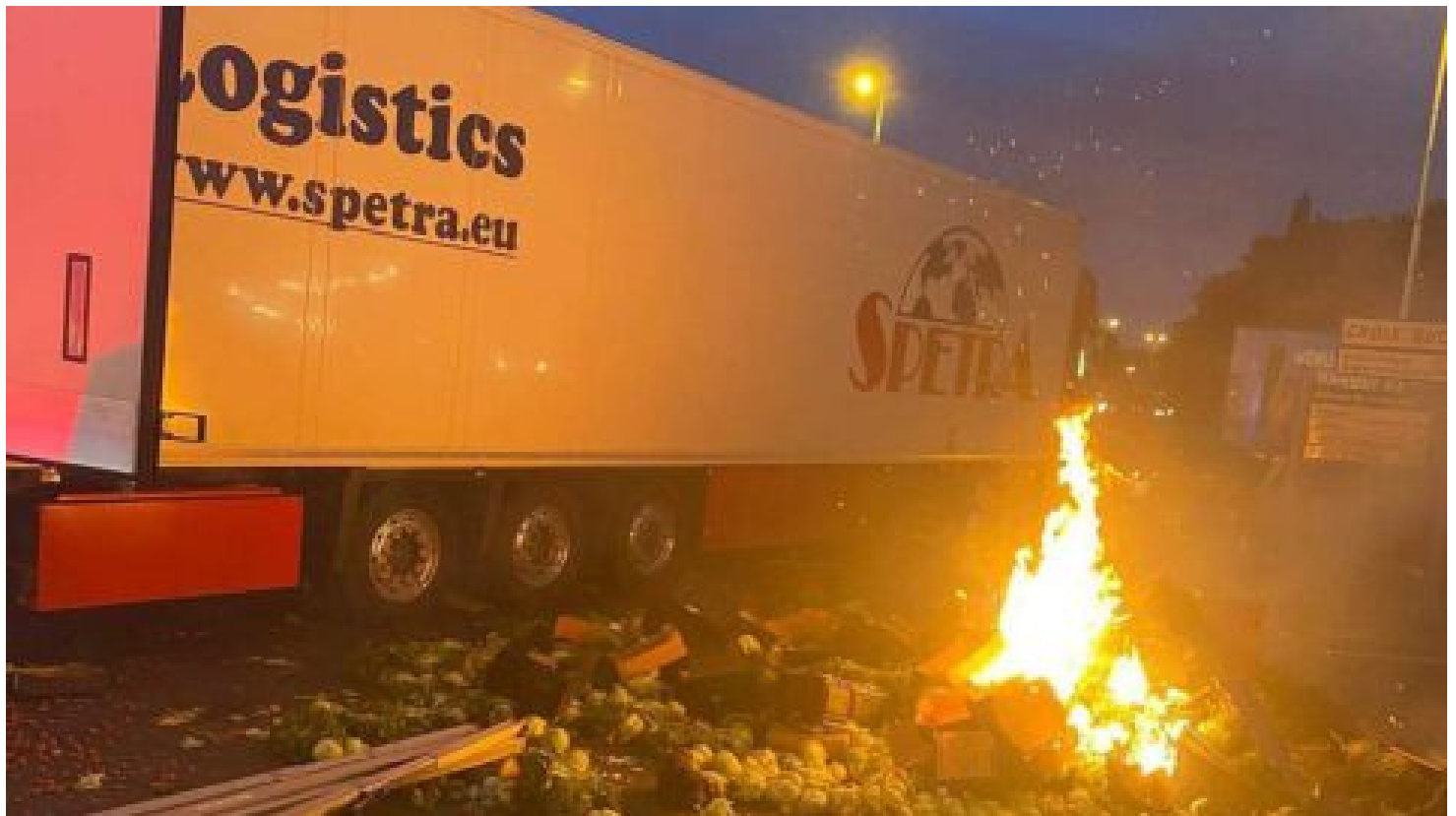
Kamioňáci ve Francii drancují naše kamiony, zlobil se Zdechovský