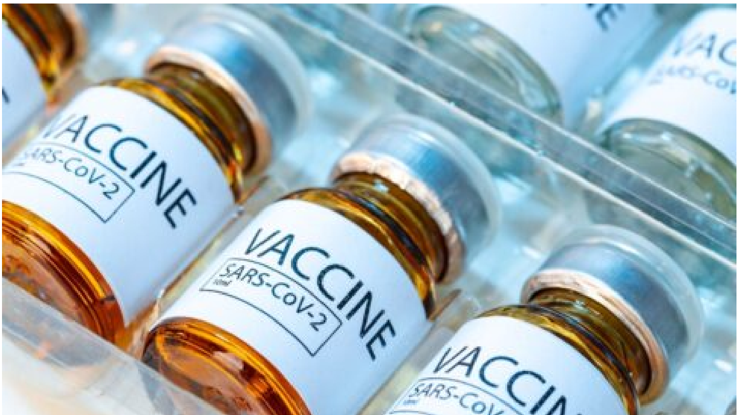
Časovaná bomba nárůstu rakoviny po booster očkování na covid