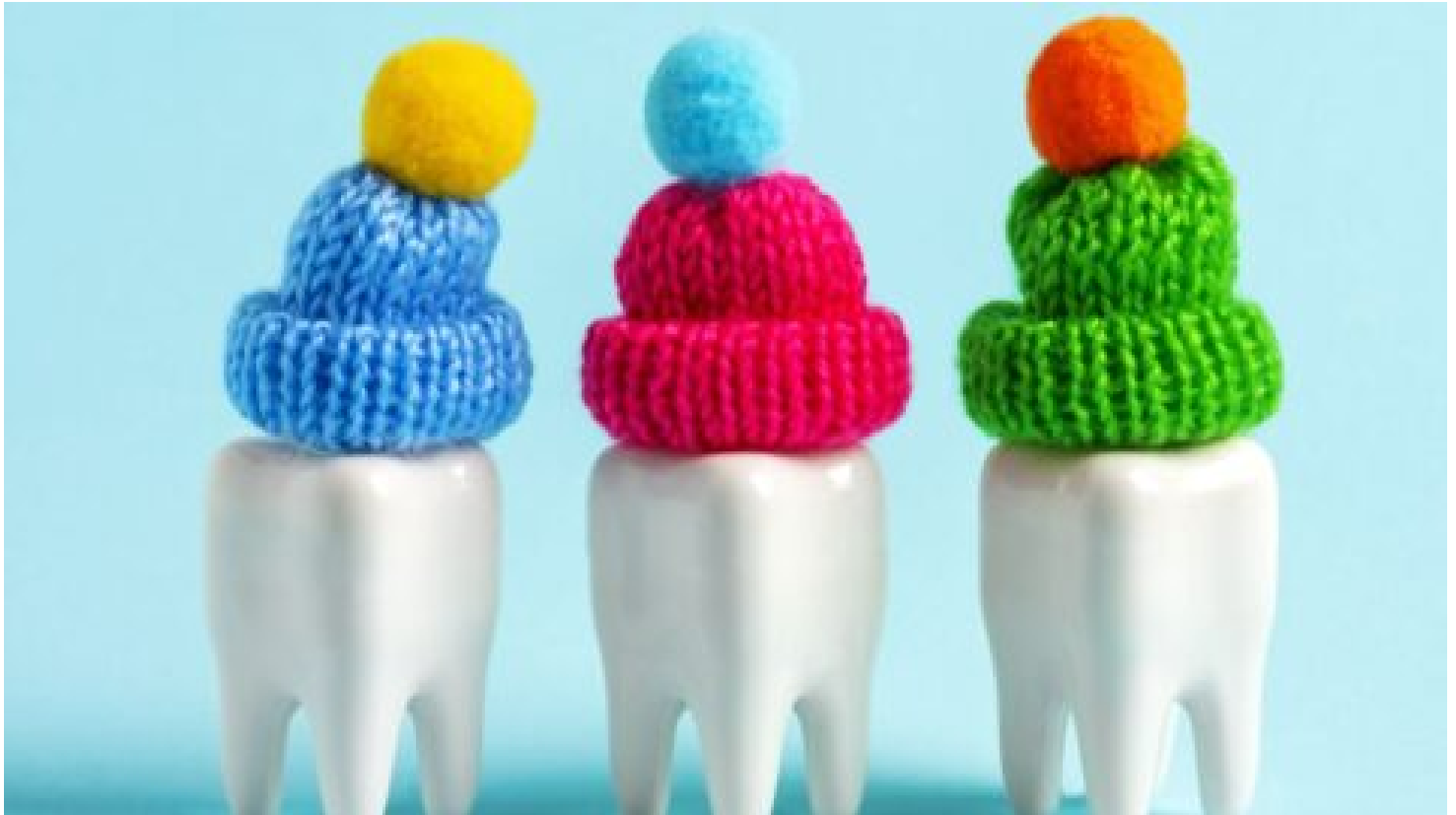
Japonští vědci vyvinuli převratný lék, který vypěstuje nové zuby