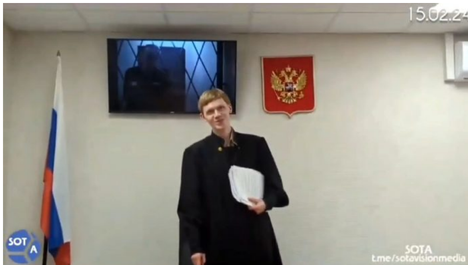
Navalný vtipkoval s mladým soudcem o tom, aby mu poslal nějaké peníze na účet

Pokud Navalnému někdo ke smrti pomohl, aby poškodil Kreml a mediálně překryl pád ukrajinské fronty v Avdějevce, potom má Vladimir Putin někde okolo sebe zrádce. To je špatná zpráva pro Kreml. Pokud se ale ukáže, že se Navalný stal obětí opakovaných boosterů ruského Sputniku, je to možná ještě horší zpráva pro Kreml. Tím by se ukázalo, že ruský Sputnik je v podstatě podobný, ne-li stejný jako AstraZeneca či Johnson & Johnson.