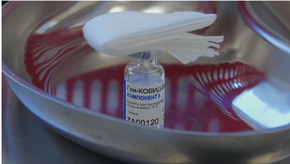
Adenovirová vektorová vakcína Sputnik-V

Náhlý a akutní infarkt SDS spojený s okamžitou zástavou srdeční činnosti je událost, která proběhne během několika sekund a oběť zemře prakticky okamžitě a na místě, nejpozději do 2 minut od spuštění syndromu. Obětí SDS syndromu se už stali očkovaní sportovci, fotbalisté, tenisté, atleti, ale i malé očkované děti poté, co vlezly do horké vany [2].