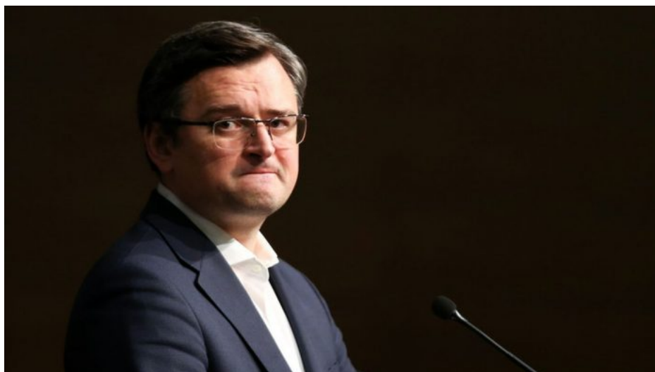
Dmytro Kuleba, ministr zahraničí Ukrajiny

A právě i tyto rezervy navrhl Petr Pavel ze skladů evropských armád vyprázdnit. Přitom v kontrastu s tím se neustále v médiích tvrdí, že Putin chce napadnout NATO a chce pokračovat po Ukrajině útokem na NATO. Jenže, pokud by to byla pravda, potom odevzdávání munice a zbraní aktivního určení Ukrajině by bylo vlastně sebevraždou a řízeným odzbrojováním zemí NATO. Proč tedy Petr Pavel v Mnichově oznámil, že se podařilo identifikovat 800 000 kusů dělostřelecké munice v EU, kterou lze odeslat na Ukrajinu, ale když to zopakovala dánská premiérka, tak nikdo z pódia netleskal?