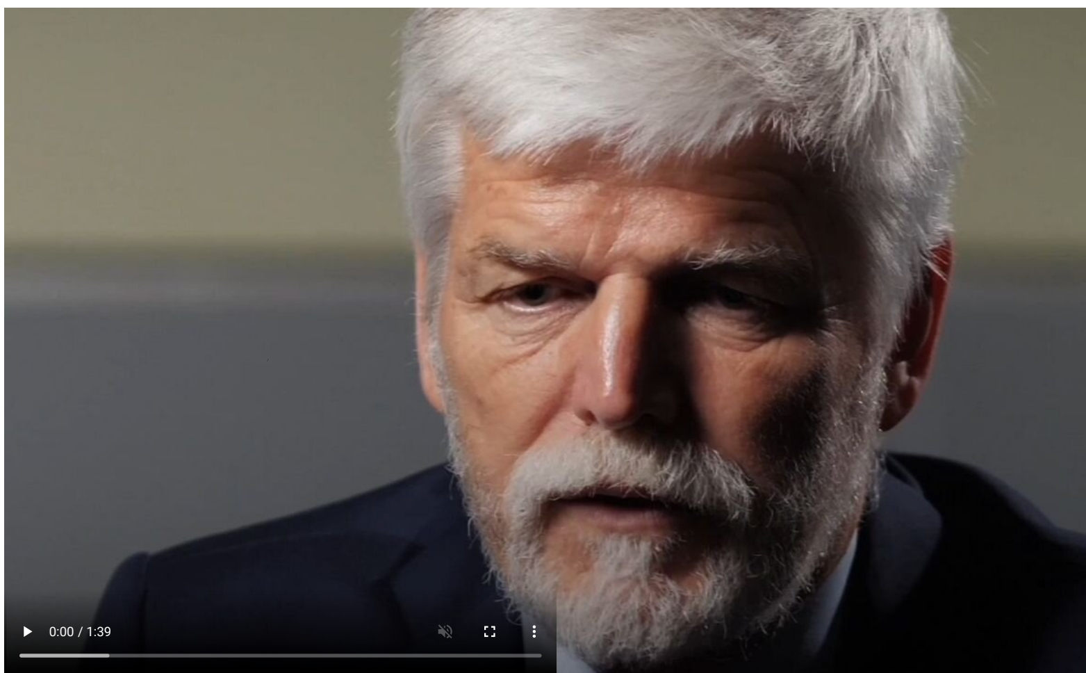
Petr Pavel prohlásil, že konflikt na Ukrajině se blíží do bodu vyčerpání sil a k vyjednávání!

Výzvy k předání veškerých zbraní Ukrajině představuje totiž proces odzbrojování NATO skrze záminku na Ukrajině a např. Američané před takovými kroky varovali už několikrát . Evropa je však tlačena do pozice, aby předala Ukrajině všechny zbraně a munice, včetně zbraní a munice aktivního určení, tedy té munice a těch zbraní, které jsou v aktivní výzbroji a v aktivních skladech armád zemí NATO. Proto ruští novináři sledují výroky evropských politiků a identifikují možné agenturní vazby na ruskou GRU, tedy osoby, které vyzývají k odzbrojení evropských armád skrze dodávky munice a zbraní aktivního určení.