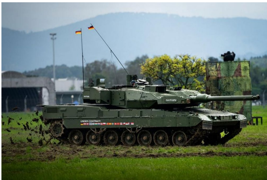
Leopard 2A8 německého Bundeswehru

Teď ale na Mnichovské konferenci zaznělo, že ČR se podařilo identifikovat 500 000 dělostřeleckých granátů ráže 155 mm a 300 000 granátů ráže 122 mm. Podle našich informací jde o munici několika armád evropských členů NATO plus Kanady, hovoří se jmenovitě o veškerých zásobách Bundeswehru, ale i Švédska a několika dalších evropských zemí NATO. Pokud k tomu dojde, tyto země budou zcela zbaveny a odzbrojeny od dělostřelecké munice. Pokud by došlo k lodnímu výsadbku Ruské armády na severu Německa, tak Ruská armáda dojde bez odporu až do Berlína, protože Bundeswehr nebude mít čím střílet proti ruské pěchotě a proti motostřeleckým divizím. Tohle není normální.