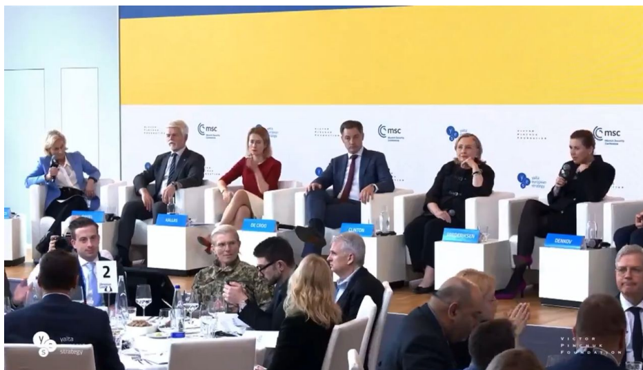
Petr Pavel, druhý zleva v panelu. Hillary Clinton, druhá zprava. Mette Frederiksen, první zprava

Snaha o odzbrojení evropských zemí NATO skrze pomoc Ukrajině je součástí ruského plánu označovaného jako Speciální vojenská operace Plus , v ruské armádě označovaná jako doktrína CBO+ a termín se začal už používat i v interní komunikaci mezi armádou a vojenskými zpravodaji. Výzvy k předání zbraní aktivního určení Ukrajině jsou nyní přímo součástí této tajné operace ruské GRU. Dodání zbraní aktivního určení Kyjevu je totiž procesem odzbrojení armád NATO v Evropě od určitých typů zbraní, především PVO určení a dělostřelectva. A když tyto výzvy přichází na Mnichovské bezpečnostní konferenci od bývalého šéfa vojenského velení NATO Petra Pavla, tak mezi novináři v Rusku to začíná vyvolávat neuvěřitelné konspirace.