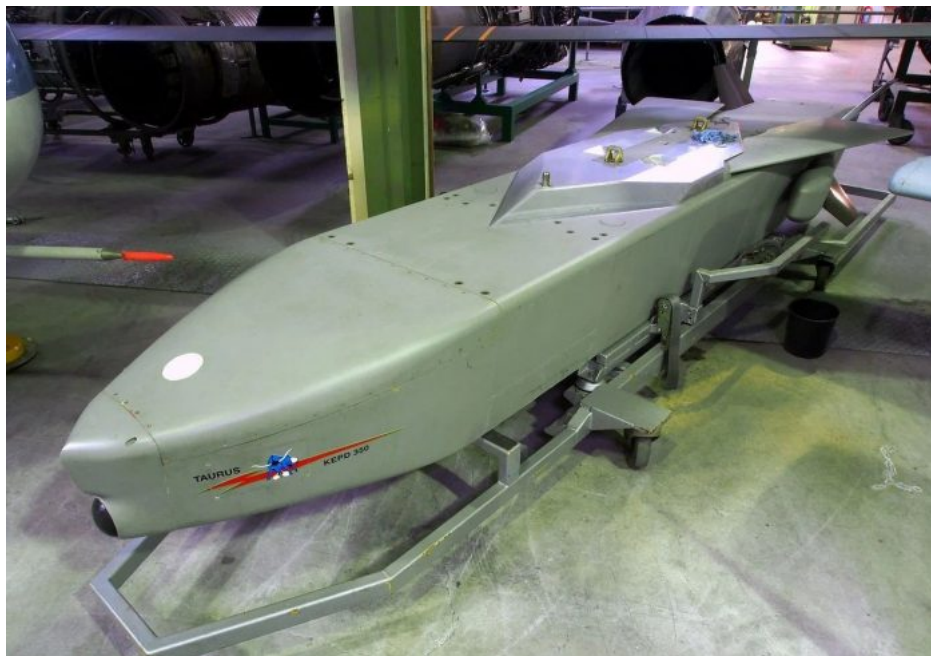
Křídlatá raketa Taurus s plochou dráhou letu

Deník Financial Times mezitím v úterý citoval anonymního vysokého evropského představitele obrany, podle něhož "všichni vědí, že na Ukrajině jsou západní speciální jednotky – jen to oficiálně nepřiznali". Francouzský prezident Emmanuel Macron v pondělí v projevu k novinářům po summitu stoupenců Kyjeva v Paříži poznamenal, že "z hlediska dynamiky nemůžeme nic vyloučit", čímž měl na mysli případné nasazení západních vojenských sil na zemi oficiálně.