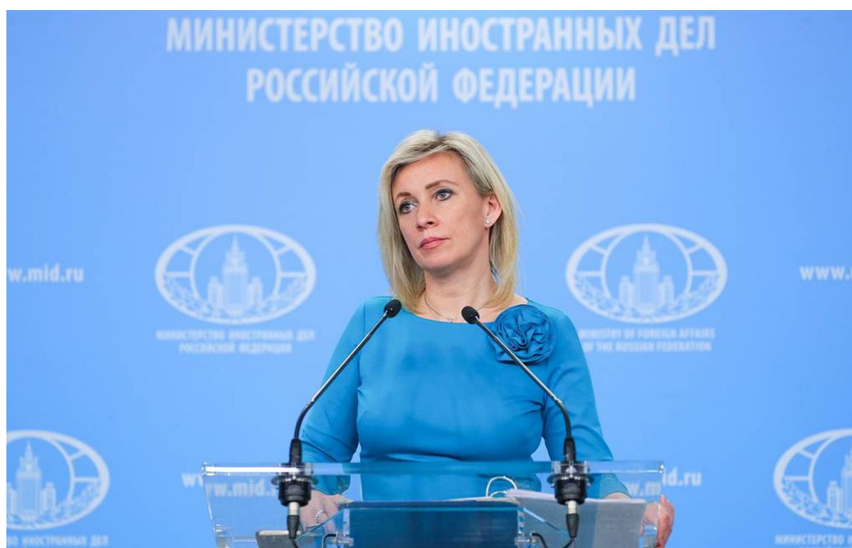
María Zacharova, mluvčí ministerstva zahraničí RF

Během čtvrtletního slyšení ve výboru pro ozbrojené služby Sněmovny reprezentantů USA Austin naznačil, že ruský prezident Vladimir Putin “nepřestane”, pokud jeho síly zvítězí nad Ukrajinou. Sousedé Ruska v Pobaltí “ Putinovi a jeho schopnostem rozumí. A upřímně řečeno, pokud Ukrajina padne, upřímně věřím, že NATO bude bojovat proti Rusku, ” řekl šéf Pentagonu. V příspěvku na Telegramu později během dne Zacharovová uvedla, že si klade otázku, zda Austinovy výroky byly “ přímou hrozbou Rusku, nebo pokusem vymyslet záminku pro ukrajinského prezidenta Vladimira Zelenského? ”. “ V obou případech je to šílené, ” zdůraznila. “ Ale teď všichni vidí, kdo je agresor – je to Washington. ”