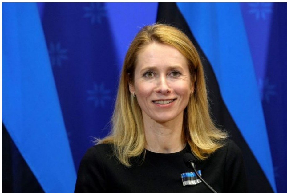
Kaja Kallas, premiérka Estonska

Konceptuální lavina se řítí ze svahu naplno a uvidíme, co přinesou následující dny. Před týdnem bylo ticho po pěšině a o týden později už se hovoří v americkém kongresu o válce NATO s Ruskem a 4 země NATO chtějí vyslat vojáky na pomoc Ukrajině, jenom čekají na více kumpánů a větší počet účastníků této šílené a ke III. sv. válce vedoucí operaci.