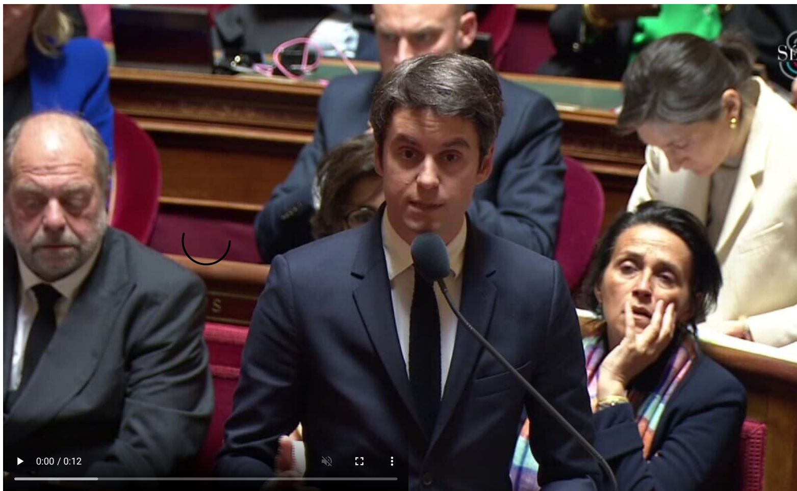
Francouzský premiér vlády podpořil Macronova slova o vyslání vojáků na Ukrajinu!

Cílem vypouštění těchto informací v lavině je navodit u veřejnosti dojem, že již je nejen rozhodnuto, ale vlastně se nic neděje, vlastně je to správně a vlastně se to mělo udělat dávno. Je to v podstatě humpolácké posouvání okenice Overtonova okna, kdy se okno namísto opatrného posouvání rovnou na hulváta vytrhne z pantu, spustí se obrovský řev, veřejnost se zaplaví zoufalými obrázky, neštěstím a semknutými zmrdy, kteří najednou pláčou, že je potřeba udělat vše, aby se zabránilo nejhoršímu. A doslova na hulváta se tak vyrvané Overtonovo okno nasadí na nemyslitelnou díru ve zdi, která vede rovnou na bitevní pole a do války na Ukrajině. A přesně tohle se začalo dít tento týden.