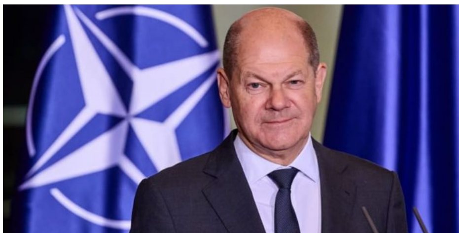
Olaf Scholz, německý kancléř

A to neplatí jen o české armádě, tenhle problém už řeší i německý Bundeswehr, který je tak zásadně proti myšlence války s Rusy, že ani kancléř Olaf Scholz nechce Ukrajincům dodat rakety Taurus dlouhého dosahu. A právě Scholz nedopatřením prozradil utajovanou informaci, že na Ukrajině už jsou rozmístěni vojáci z Francie a z Británie, a že tam obsluhují západní raketové systémy dlouhého dosahu. Německý kancléř Olaf Scholz se totiž dostal pod palbu kritiky [5] ze strany Velké Británie poté, co naznačil, že v konfliktu na Ukrajině působí britské (a rovněž francouzské) jednotky. A je to venku oficiálně!