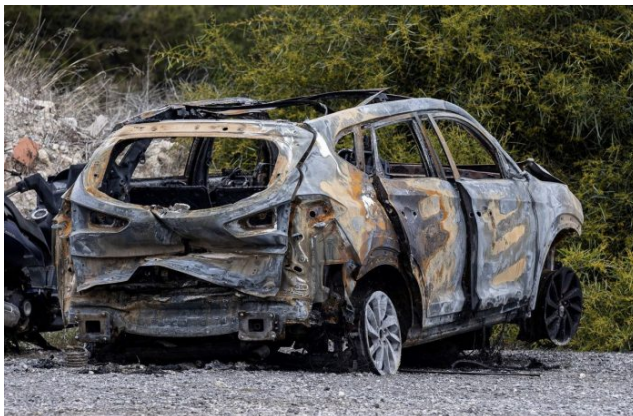
Ohořelé auto útočníků, kteří po sobě zamestli stopy

Ukrajinci k němu jako k Rusovi neměli úctu, prostě poté, co jim přivezl v helikoptéře náhradní díly na stíhačky, tak propálili jeho identitu v ukrajinské televizi a udělali z něho ukrajinskou hvězdu a současně s tím i chodící mrtvolu. Jedna věc je defekce, tedy zběhnout k nepříteli. Druhá věc je ale dvojnásobná vražda spolubojovníků při tomto zběhnutí.