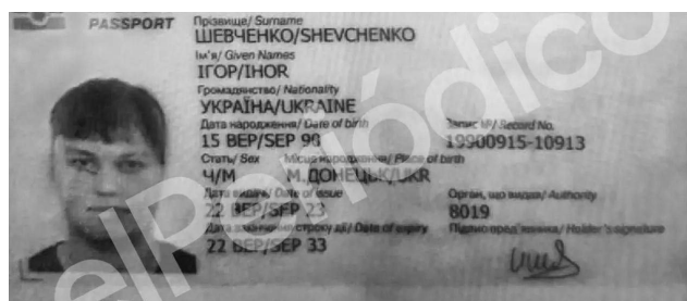
Španělský tisk uveřejnil pas Kuzminova pod cizí identitou Ihora Ševčenko

Podle listu El País [1] na základě údajů ze sčítání lidu žije v samotné Villajoyose přibližně 1 200 Ukrajinců a 800 Rusů, zatímco v širším regionu Alicante žije více než 11 000 Ukrajinců a 17 457 Rusů. Deník El País popsal tento region jako "jámu lvoovu" pro každého, kdo je zapojen do konfliktu a chce se skrýt, a uvedl, že Kuzminov sice zřejmě požádal o umístění v této oblasti, ale vyhýbal se nakupování ve východoevropských obchodech nebo návštěvě oblíbeného místního pravoslavného kostela, který je pravidelně naplněn Rusy a místní mu přezdívali "kostel Moskva".