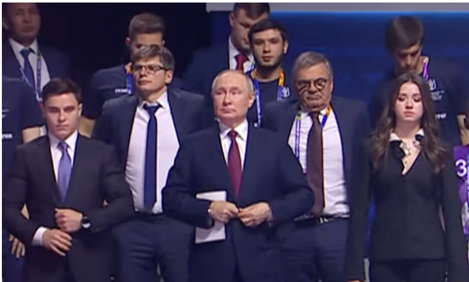
Vladimir Putin sledoval ceremonii spolu s Kamilou Valijeovou, Andrejem Aršavinem a Nikitou Nagornym.

Zvěsti, že diskvalifikovaný krasobruslař bude mezi čestnými hosty Future Games, se objevily před pár dny. Nikdo si ale nepředstavoval, že na zahajovacím ceremoniálu bude Valieva sedět po levé ruce Vladimira Putina.