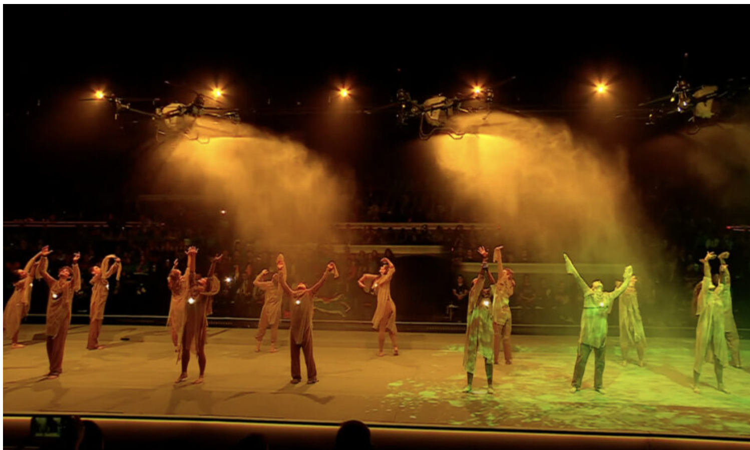
Vystoupení se ukázalo jako pestré. Foto: Přenos ze zahajovacího ceremoniálu