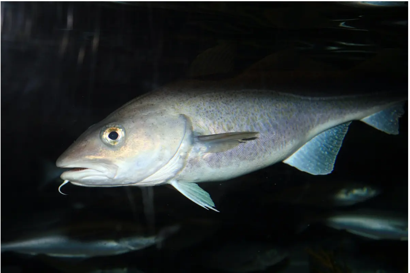
Treska obecná. Ilustrační foto

„Zákaz rybolovu pro Brity není nic jiného než legální a s ohledem na situaci vhodná reakce Moskvy na nepřátelské akce Londýna,“ poznamenal místopředseda Rady Federace Konstantin Kosačov.