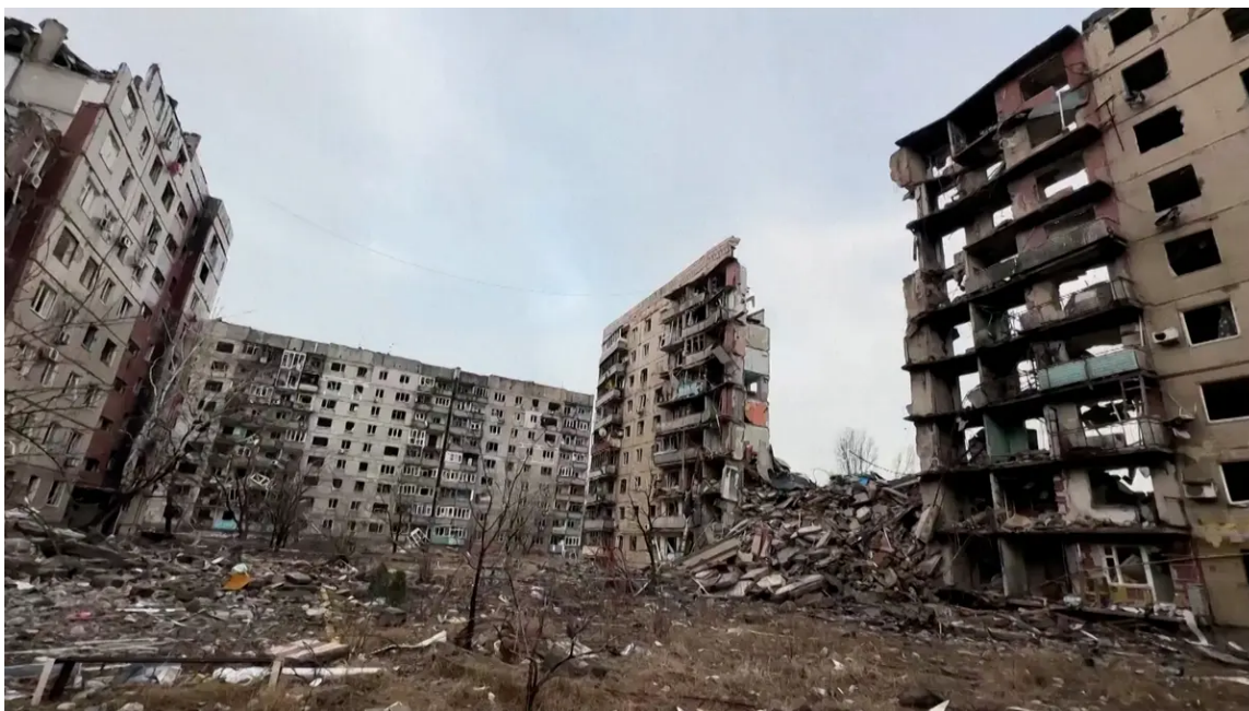
Zdevastované ukrajinské město Avdijivka

Tarnavskij nově na Telegramu označil rozhodnutí o stažení za situace, kdy nepřítel postupuje přes mrtvoly vlastních vojáků, má desetinásobnou přesilu a pokračuje neustálé bombardování za „jediné správné řešení“. Vojáci podle něj už zahájili obranu na nově určených liniích.