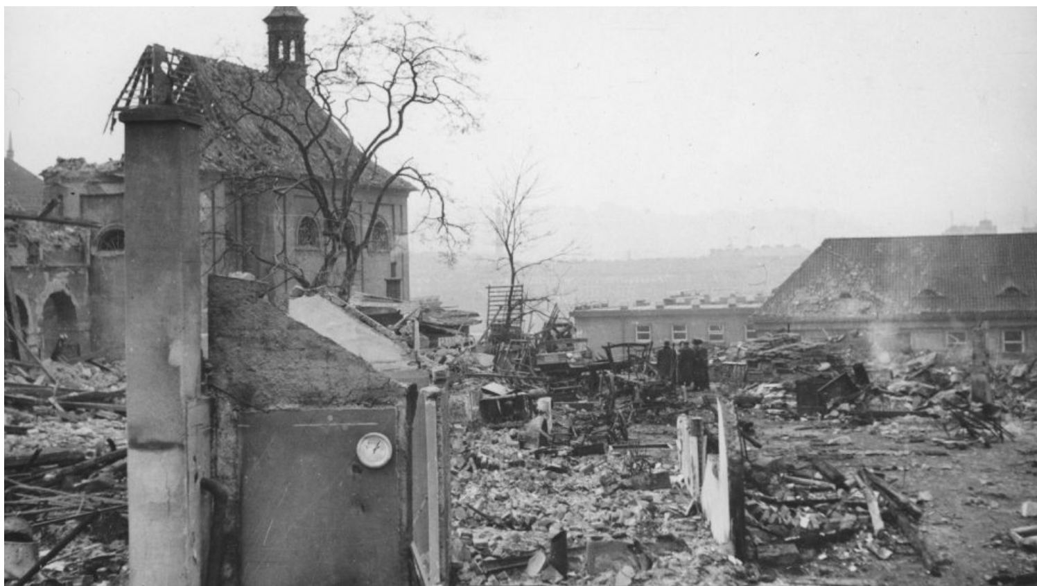
Emauzský klášter po bombardování z 14. února 1945.

»Největší audioportál na českém internetu