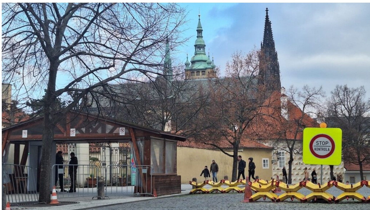
Pražský hrad, 8. březen 2023

Kverulant.org roky usiloval o navrácení areálu Hradu veřejnosti. K otevření sice došlo, ale je to otevření dosti rozpačité a nemusí být trvalé. Kauza v červenci 2023 pokračovala soudem se Správou Pražského hradu. I prezident Petr Pavel totiž trval na tom, že přístup veřejnosti do areálu má být výrazně omezen, prý se mu tak bude lépe vládnout. Městský soud pravomocně rozhodl, že areál Pražského hradu není veřejným prostranstvím, tedy místem, kam by veřejnost mohla vstupovat bez omezení. Kverulant se s tím odmítá smířit a podal kasační stížnost. Pokud si myslíte, že Pražský hrad má patřit široké veřejnosti, a nikoli „panovníkovi“, pomozte Kverulantovi nést náklady na právní zastoupení alespoň symbolickou částkou.