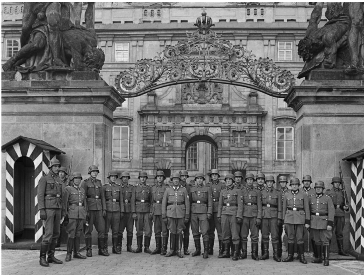
SS na Pražském hradě, 21. srpna 1942, foto: ČTK

Pouze v případě německé okupace v roce 1939 byl Pražský hrad obsazen německými vojsky, která zabránila volnému průchodu osob. „I. nádvoří němečtí vojáci uzavřeli strážemi, takže příchod na Hrad byl se strany Hradčan možný jen IV. nádvořím (průchod I. nádvořím byl uvolněn ve druhé polovině dubna 1939). Na požádání umožnili však p. kardinálovi průjezd Matyášovou bránou ve dnech velikonočních svátků. Třetí nádvoří uzavřeli strážemi u podjezdu k chrámu sv. Víta a pod chodbou do oratoře. Projítí směl jen ten, kdo se mohl vykázat legitimací, kterou vydalo velitelství 3. sboru. Takové legitimace obdrželi všichni zaměstnanci kanceláře prezidentovy. Kontrola dala se liberálně a při vchodu pod balkonem na III. nádvoří vůbec ne,“ píše Pavel Zeman v publikaci Paměť a dějiny.