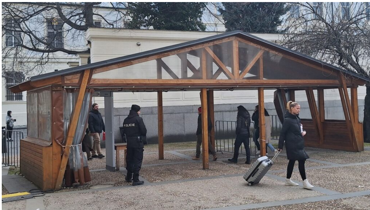
Pražský hrad, 8. březen 2023, foto: Kverulant.org

ČTK už na jaře 2023 přinesla zprávu, že Pleskot s Pavlem prošli velkou část Hradu a slíbili revitalizaci symbolu naší státnosti, zdá se že ani po roce k žádné viditelné změně nedošlo.