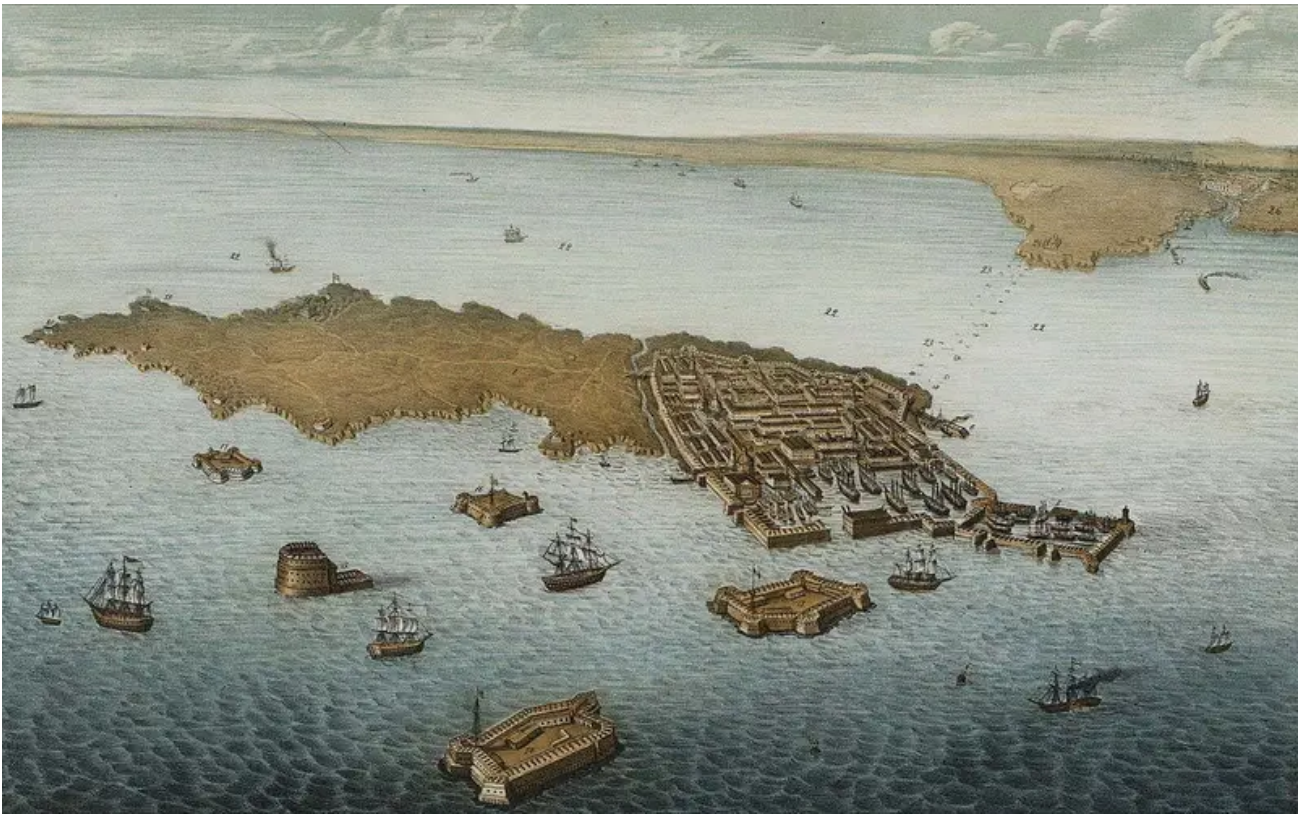
Pevnost Kronštadt v roce 1854

Cochrane byl hluboce rozrušený odmítnutím jeho jmenování, ale protože chtěl pomoci Anglii během války, obrátil se přímo na královnu Viktorii.