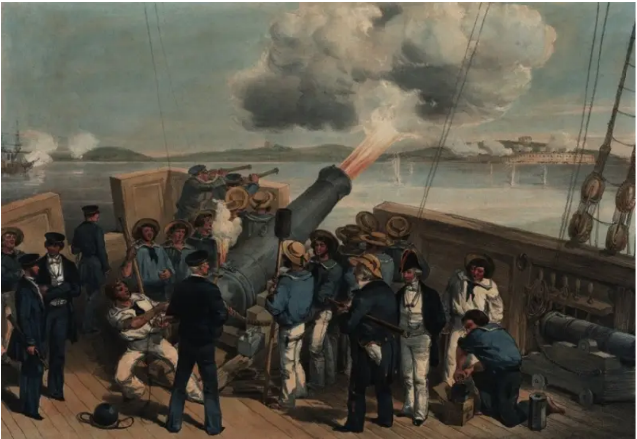
Bombardování Bomarsundu, 1854

Dalším krokem po použití „výbušné lodi“ je útok na pozemní opevnění. A zde budou vyžadovány „smradlavé lodě“. Stejně jako dříve bude k obložení starého trupu použita hlína, ale horní paluba zůstane nedotčená, aby ji bylo možné zasypat první vrstvou dřevěného uhlí a poté přidat síru rovnající se asi jedné pětině objemu paliva. Předpokládalo se, že taková „smradlavá loď“ bude spuštěna do vody proti pobřežní baterii, když vítr fouká ke břehu, a pak posádka před evakuací zapálí dřevěné uhlí.