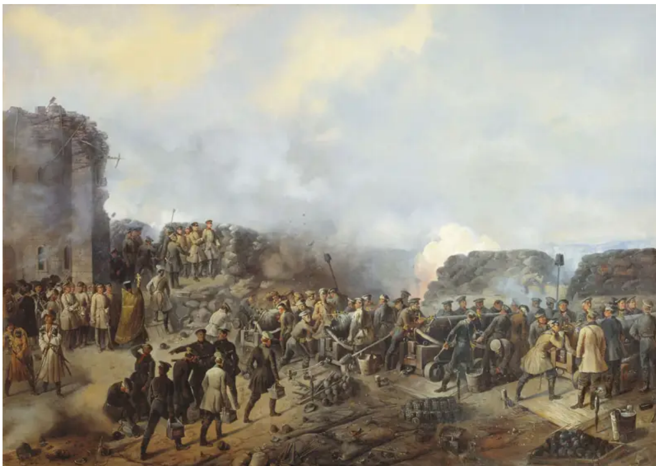
Obrana Sevastopolu, 1855

Cochrane napsal - malá parní loď je naložena sudy dehtu smíchaného se sírou a olejem a jede do nepřátelského přístavu. Směs se otvory během plavby postupně vylévá do moře, v polovině cesty se zaseknutým volantem posádka opouští loď a natahuje hodinový mechanismus. Loď postoupila dále vpřed, zapálila olej draslíkem a explodovala. Směs dehtu a síry vytváří velká oblaka kouře a způsobuje u lidí dušení. A po takovém útoku jednoduše vstoupíme do Sevastopolu nebo Kronštadu, spočítáme ruské mrtvoly a dobjeme město z moře!