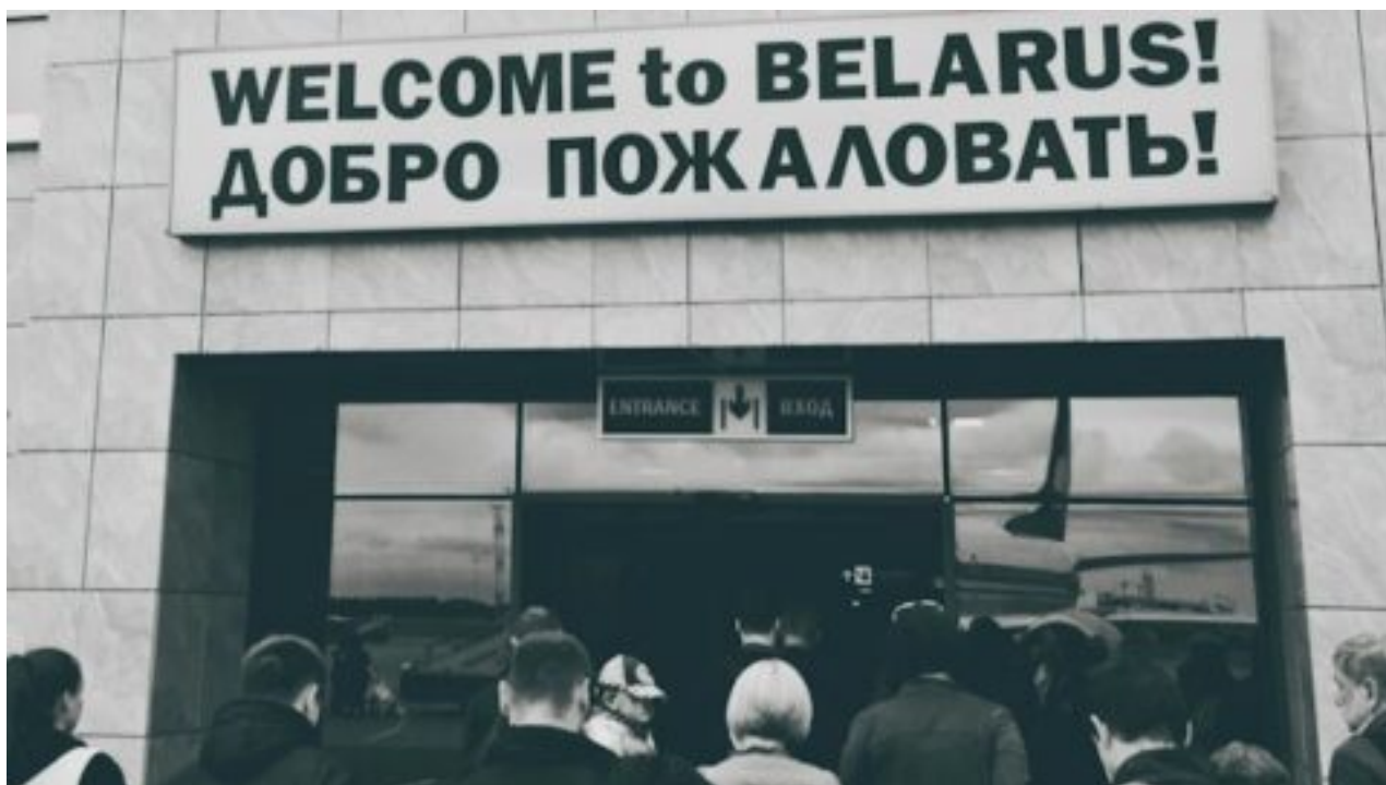
Rozhovor: Běloruský rodák vzpomíná na život v Rusku: „Bylo to drsné, jako dítě jsem se bál.“ Marcela Colucci