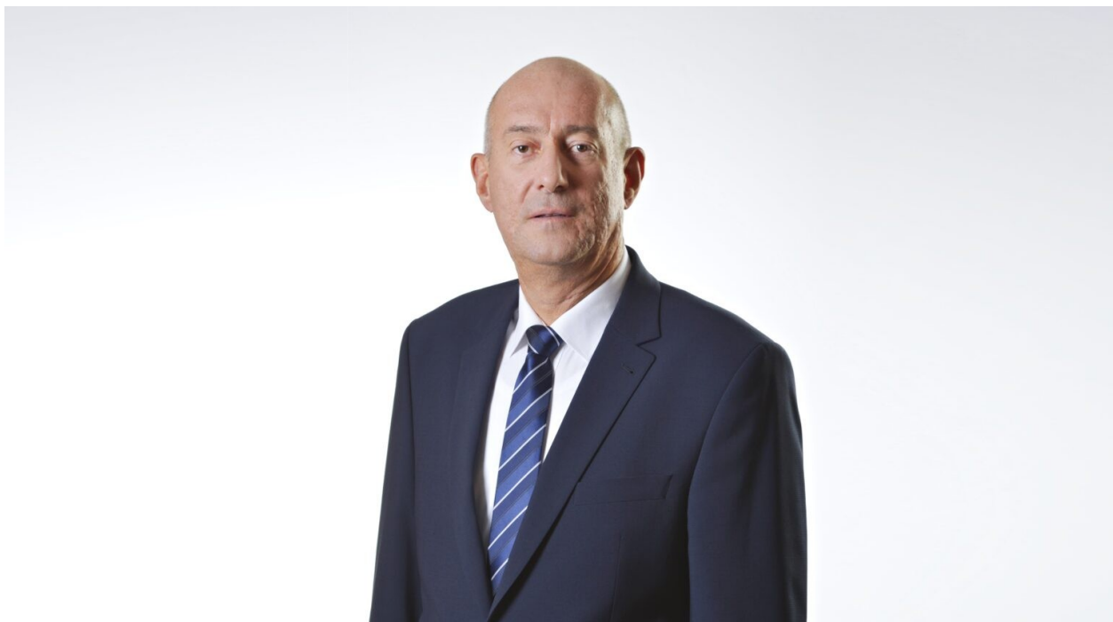
JUDr. Igor Stříž, nejvyšší státní zástupce

S vírou, že tehdy nové vedení nebude pokračovat v zakrývání faulů minulé vlády, se Kverulant počátkem února 2022 obrátil na Nejvyšší státní zastupitelství, v jehož čele stanul Igor Stříž, vystřídávší Pavla Zemana.