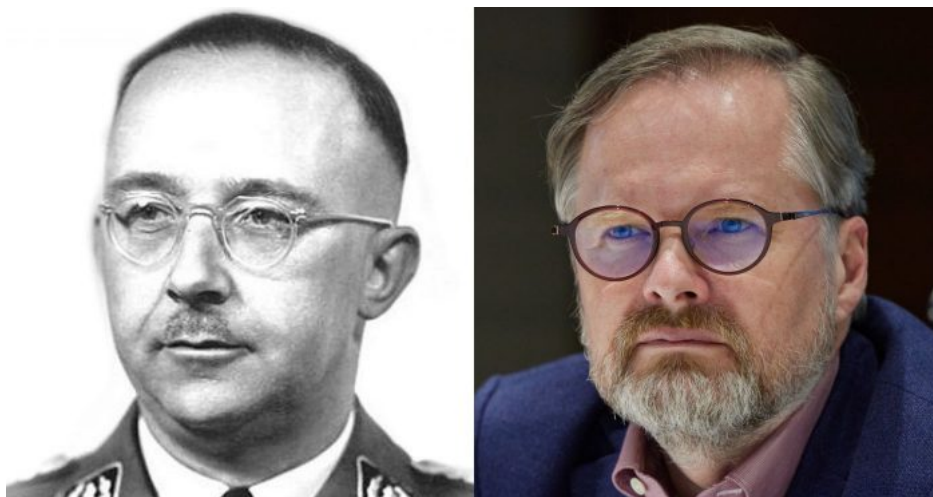
Heinrich Himmler a Petr Fiala s himmlerkami na nose

Tento výrok o budoucnosti zazněl poté, co si Attila přečetl Korčokův volební program a nakonec Attila poradil lidem, aby se u voleb rozhodli správně, koho budou volit ve 2. kole prezidentské volby. Logicky tím nepřímou podporou podpořil Pellegriniho. Attila si navíc dovolil neuvěřitelný trolling, když si na videu nasadil ty samé brýle, jaké nosí Ivan Korčok. Jedná se o tzv. módní brýle, které se nosí čistě jen jako módní doplněk a nemají funkci zdravotní pomůcky ke zlepšení zraku.