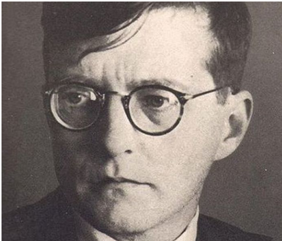
Ruský hudební skladatel Dmitrij Šostakovič

Tento kulatý design himmlerek totiž podle psychologů vytváří na lidi dojem vysoké inteligence a vzdělání, protože tyto brýle nejvíce proslavil ruský hudební génius a skladatel Dmitrij Šostakovič . Když tedy dnes politici nasazují módní brýle, jako právě pan Korčok, tak by se neměli divit, že lidé si z toho začnou dělat legraci. Nosit brýle kvůli módě je opravdu nezvyklé a pokud někdo nemá zdravotní důvody pro nošení brýlí, a nejedná se ani o brýle proti slunečnímu svitu, tak to působí na lidi hodně zvláště, neupřímně a manipulativně.