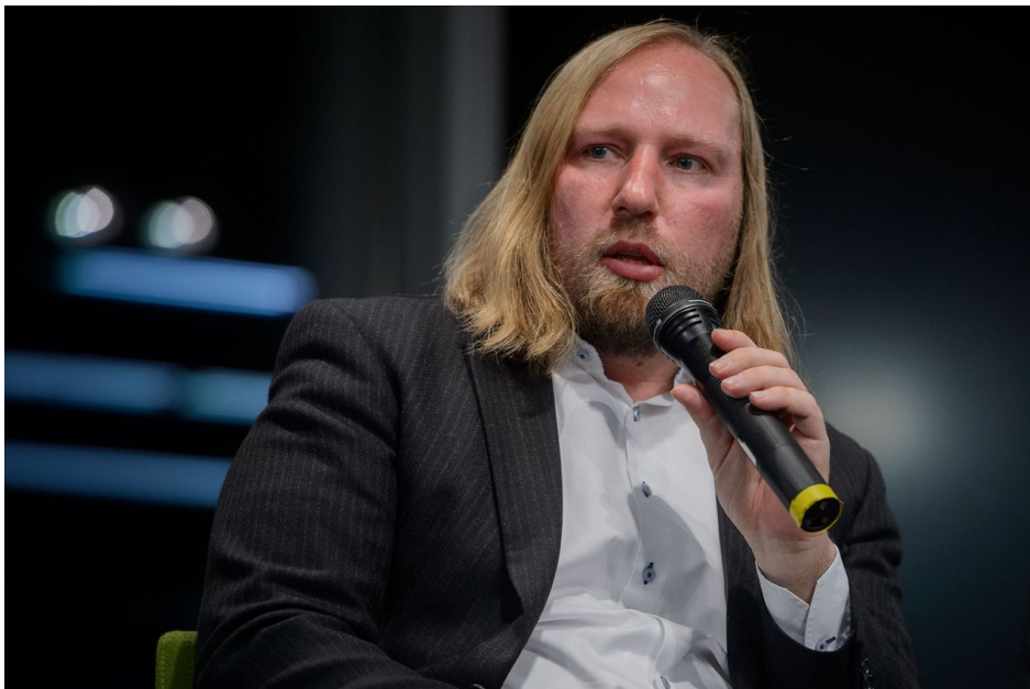
Europoslanec Anton Hofreiter

Německý europoslanec za Zelené Anton Hofreiter má zcela jiné obavy. Ten pro Funke Mediengruppe navrhl, aby byly zrušeny evropské fondy pro Slovensko, pokud Fico a Pelligrini "vezmou sekeru na slovenský právní stát a otevřou stavidla korupci" . Je prý důležité, aby Slovensko "dostalo od Berlína a Bruselu jasný varovný signál" , řekl Hofreiter. Tyto výkřiky od německých politiků pouze ukazují na to, jakým způsobem se v Německu obnovuje nacismus a formují se fašistické procesy řízení. Doslova bych se nebál ten proces označit za "renacifikaci" Německa, protože je patrné, že spolu s tím, jak vznikla situace spojeného tažení na Rusko v Evropě, tak Německo najednou začalo oživovat nacismus.