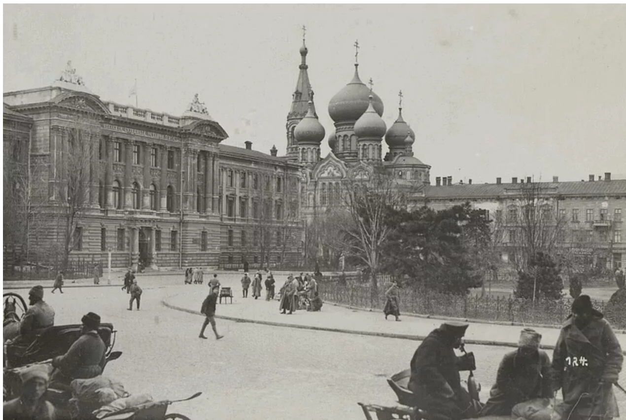
Panteleimonivska ulice v historickém centru Oděsy, 1918.

V té době se v Oděse obnovila filmová tvorba a francouzští znalci kinematografie obdivovali ukrajinskou herečku němého filmu Viru Kholodnu.