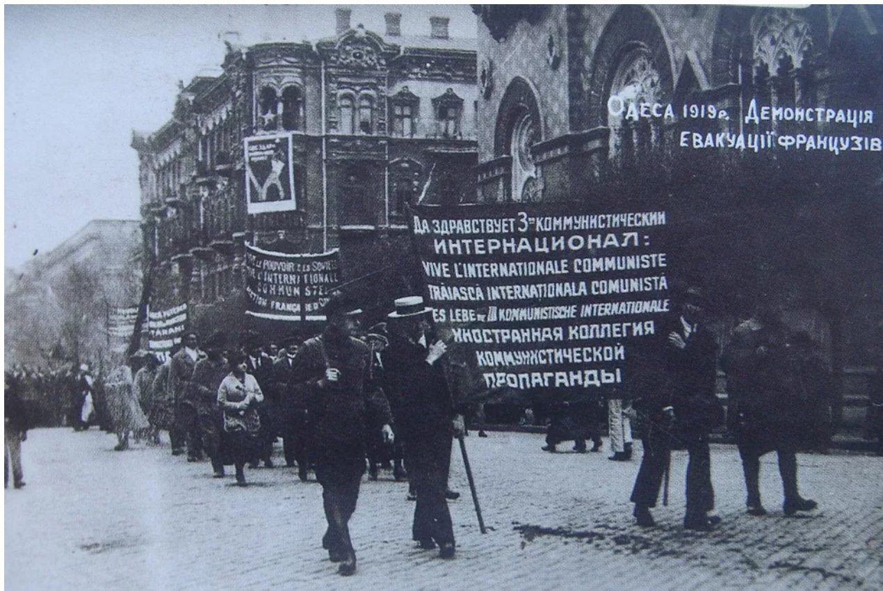
Sovětská demonstrace v Oděse po evakuaci francouzských vojsk, duben 1919. Wikimedia

6. dubna Oděsa viděla jednotky Rudé armády vedené Hryhoryivem, které se chlubily, že osobně porazil Francouze. Ale brzy, v květnu 1919, vedl povstání proti bolševické vládě na Ukrajině. Po porážce se pokusil připojit k anarchistovi Nestoru Machnovi, ale byl zabit machnovci.