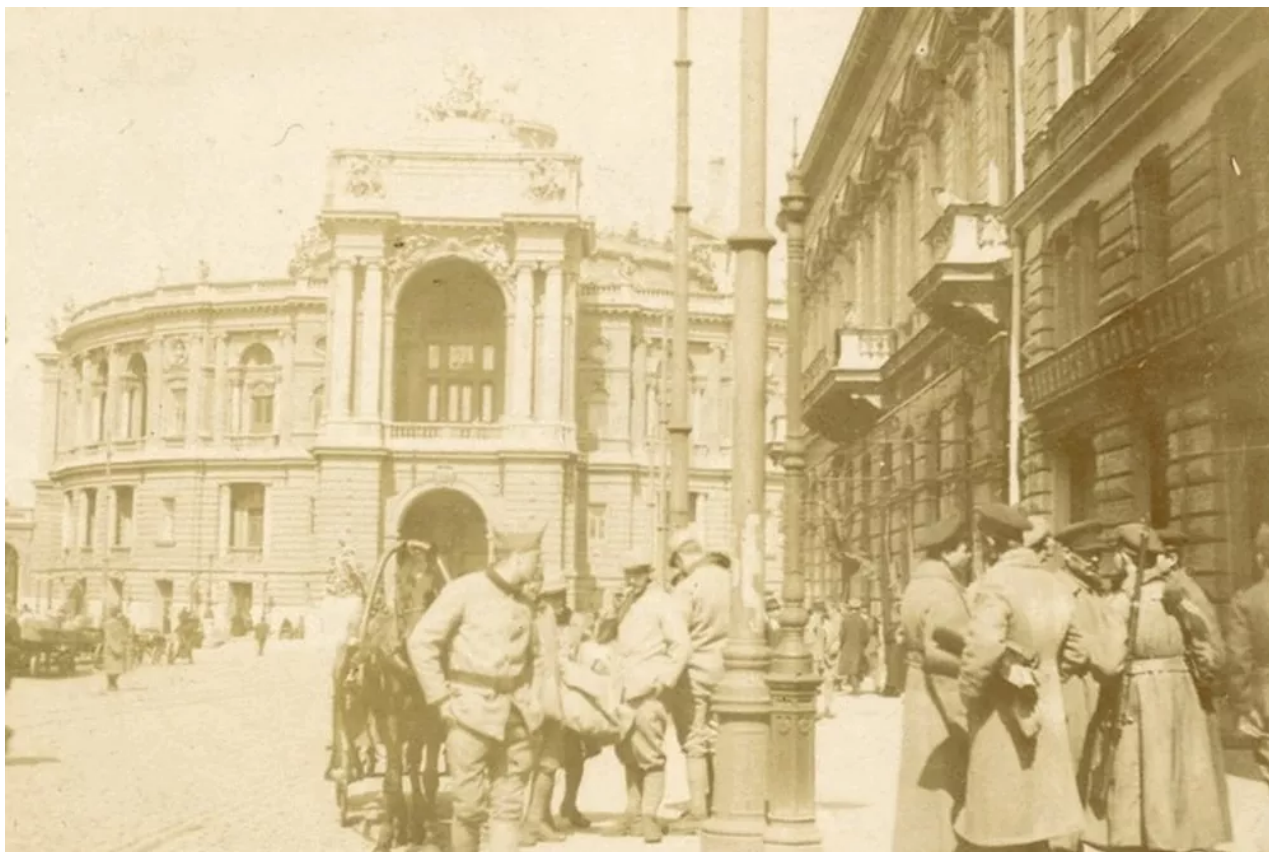
Odesa během francouzské intervence, březen 1919. Wikimedia

Do Oděsy navíc vstoupily polské, rumunské, srbské, řecké a britské vojenské prapory.