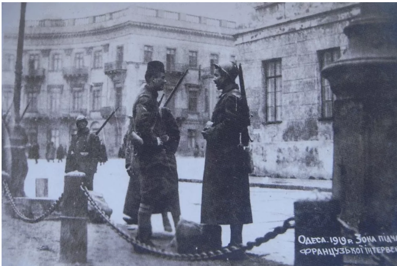
Kontrolní stanoviště francouzských jednotek v Oděse na bulváru Mykolajiv (nyní Prymorskyi), počátek roku 1919.

Do konce prosince dorazilo do Oděsy asi 15 000 francouzských vojáků, včetně senegalských, marockých a alžírských vojáků z francouzských kolonií v Africe.