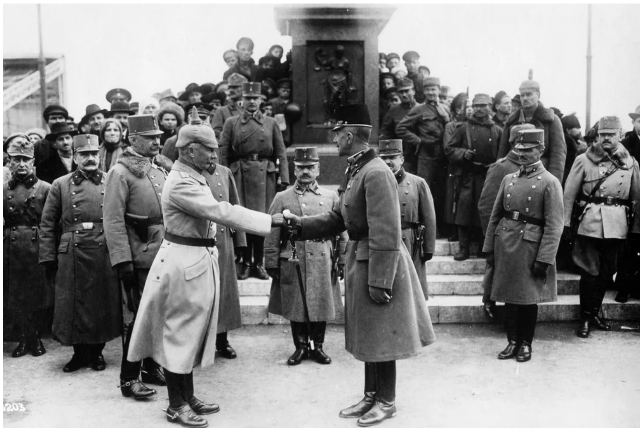
Polní maršál rakousko-uherské armády baron Eduard von Bohm-Ermolli (vpravo) v Oděse, březen 1918.

Po kapitulaci v první světové válce v listopadu 1918 se rakouské jednotky začaly stahovat z Ukrajiny. Odesa se dostala pod kontrolu jednotek hejtmana Pavla Skoropadského z UNR.