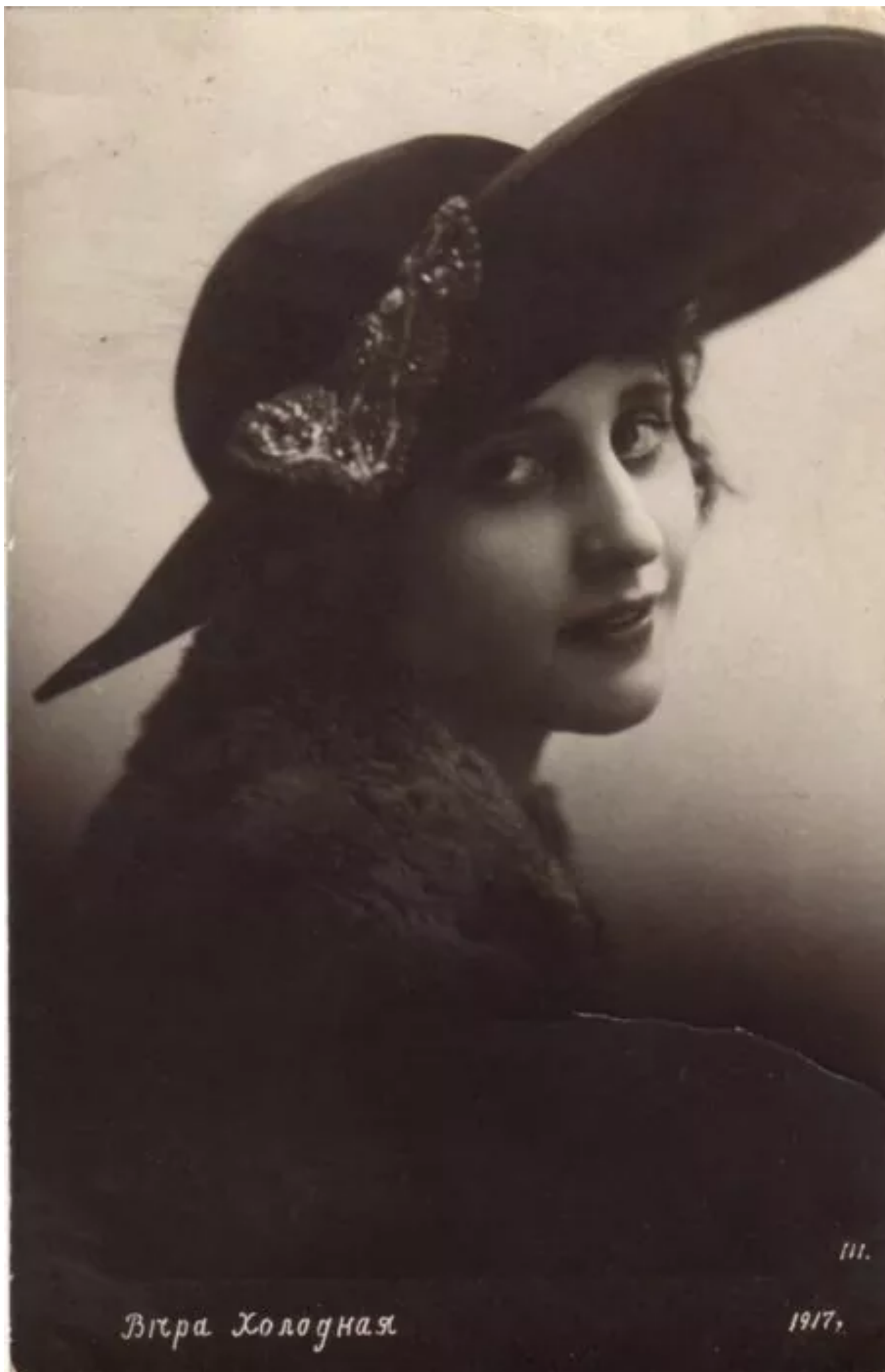
Vira Kholodna, 1917.