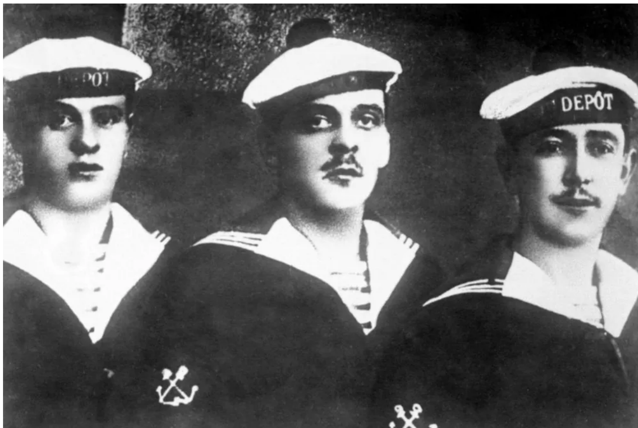
Francouzští námořníci z bitevní lodi Voltaire odsouzeni za povstání, 1919.

Velení francouzských jednotek neustále odkládalo pochod na Moskvu a francouzští vojáci nebyli dychtiví bojovat. Mezi francouzskými námořníky, kteří naslouchali bolševické propagandě, propukly nepokoje.