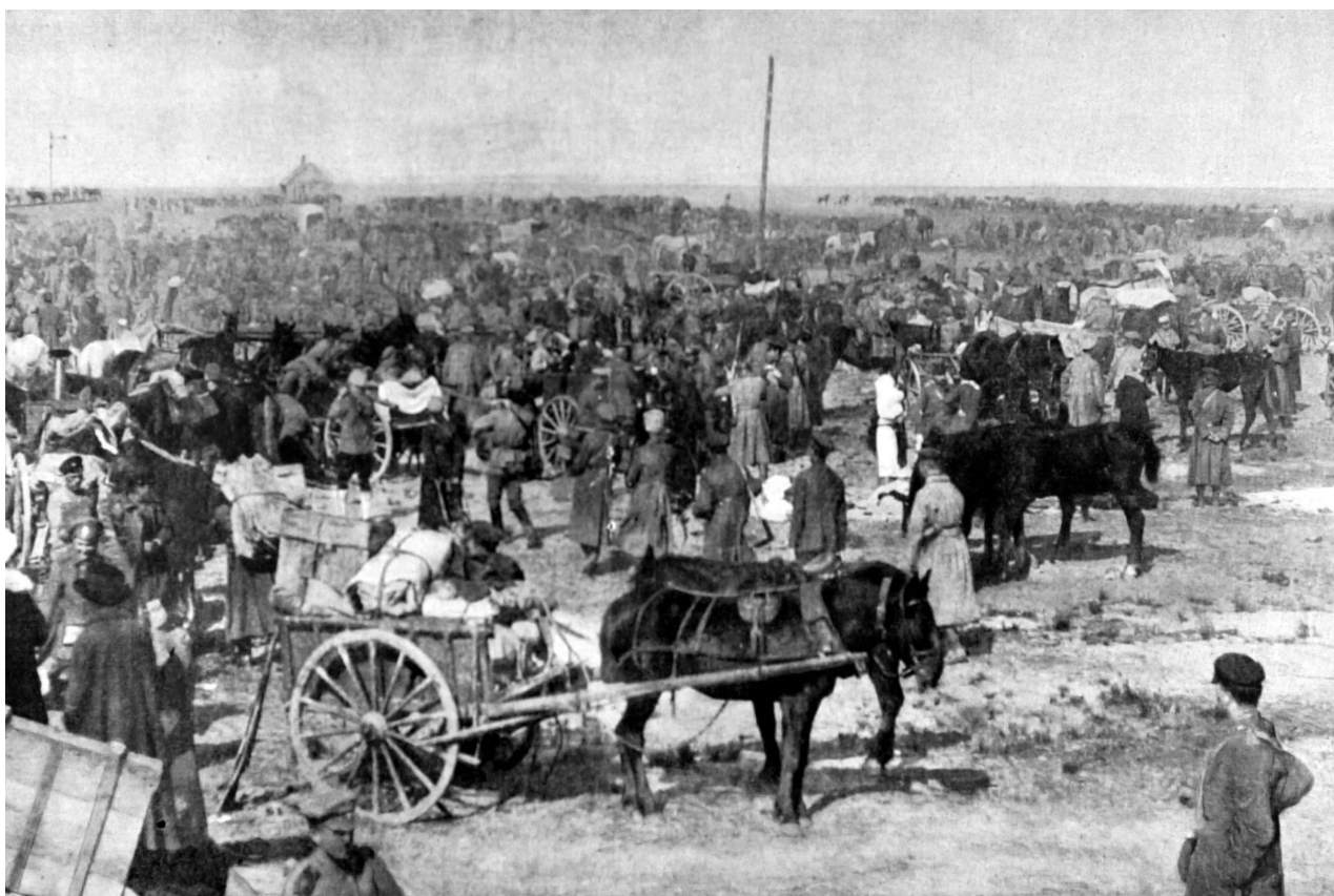
Obyvatelé Oděsy, kteří uprchli z města před příchodem Rudé armády, čekají v táboře u ústí Dněstru na nástup do francouzských vojenských člunů, duben 1919.