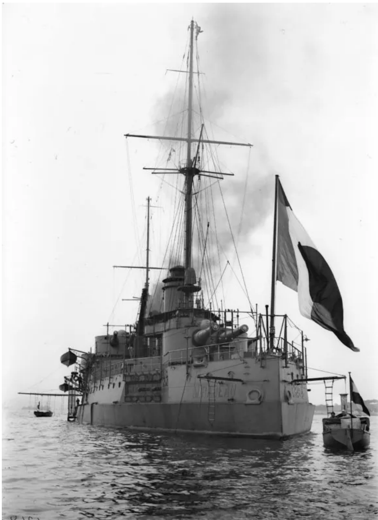
Bitevní loď francouzského námořnictva „Mirabeau“, která byla součástí eskadry u pobřeží Oděsy v prosinci 1918.

Po ultimátu francouzského velení z 18. prosince 1918 odjely jednotky adresáře UNR z města do Petljury, která nechtěla kazit vztahy s dohodou. Poté Francouzi oznámili, že berou Oděsu a Oděskou oblast „pod ochranu Francie“.