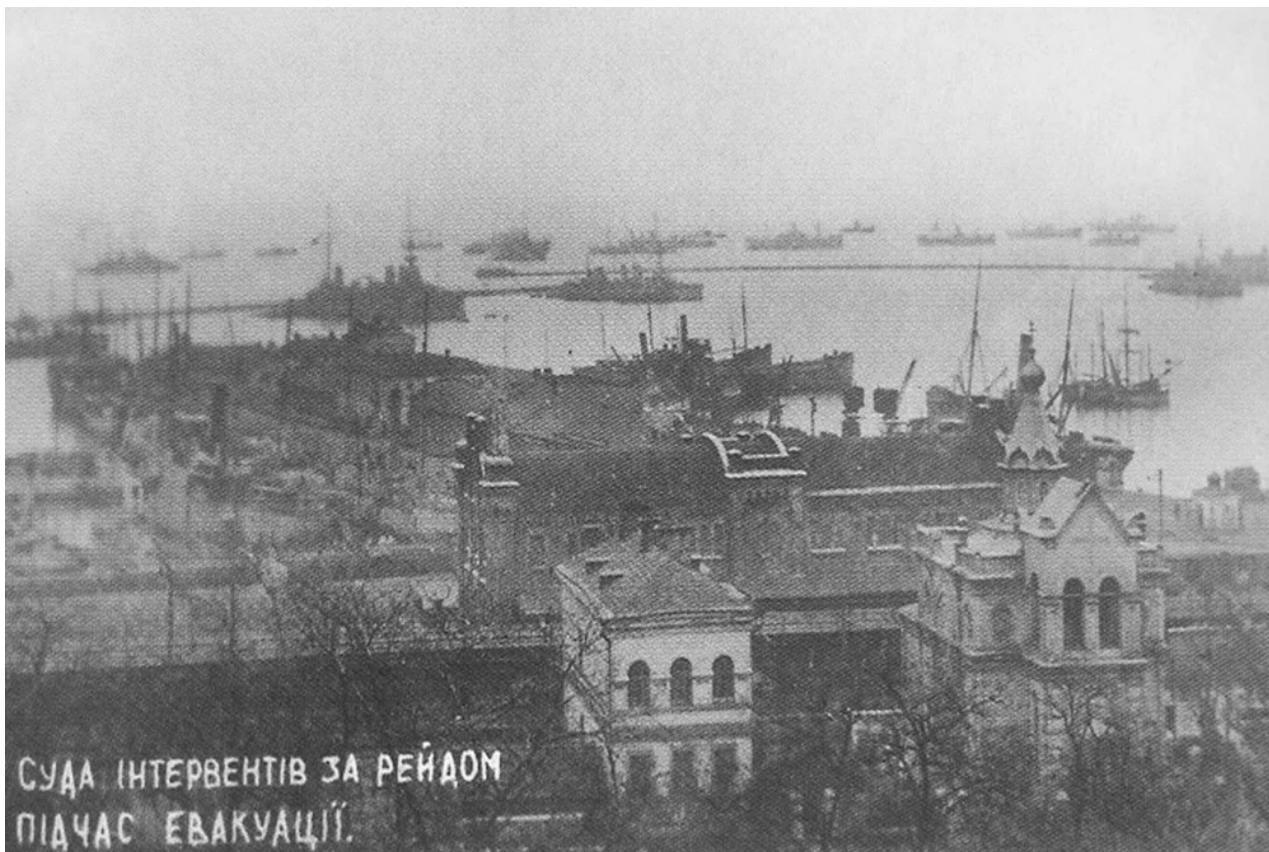
Francouzské lodě během evakuace z Oděsy, duben 1919.