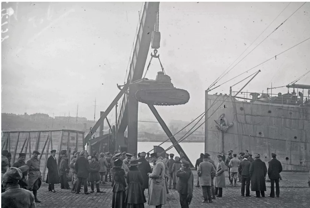
Vykládka francouzské vojenské techniky v přístavu Odesa, 1918.

Do konce prosince dorazilo do Oděsy asi 15 000 francouzských vojáků, včetně senegalských, marockých a alžírských vojáků z francouzských kolonií v Africe.