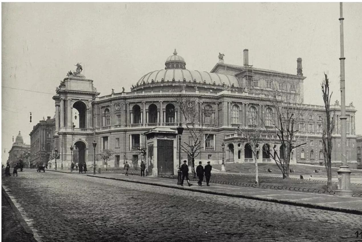
Pohled na Oděskou operu z ulice Richelieu, 1918.

Zatímco Oděsa byla francouzskou provincií, život ve městě se trochu stabilizoval – otvíraly se obchody, restaurace, divadla. Průmyslníci, bankéři a další nejbohatší lidé v rozpadající se Ruské říši se spoléhali na francouzskou ochranu a do města proudili.