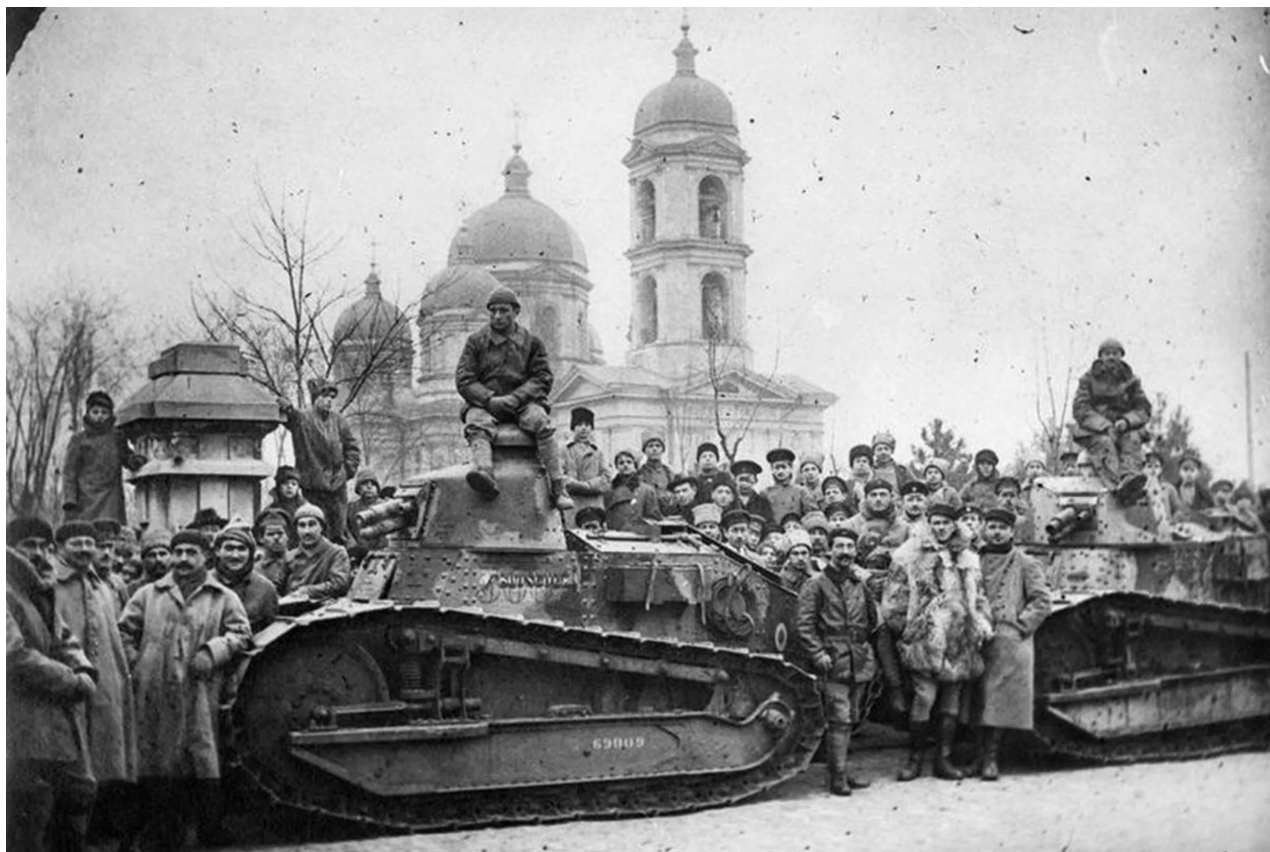
Tanky Renault s francouzskými vojáky, civilisty a bělogvardějci poblíž náměstí Oleksiivska v Oděse, 1919.

Děnikin byl považován za anglické stvoření a Francouzi to neměli rádi. Proto počátkem roku 1919 přijel do Oděsy generál Philippe d'Anselme, který stál v čele velitelství a převzal veškerou moc do svých rukou.