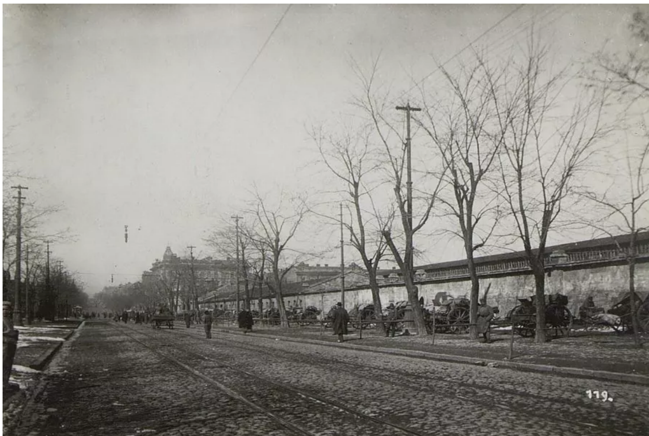
Rakouské dělostřelectvo na ulici Velyka Arnautska v Oděse, 1918.

Začátkem prosince 1918 dorazila do Oděsy francouzská eskadra válečných lodí vedená křižníkem Mirabeau. Francouzi doufali, že vyjednají se Skoropadským, aby přistáli v Oděse, pak šli do Kyjeva a odtud — aby „dohnali bolševiky v Moskvě“. Jenže v té době padl hejtmanův režim a do města vstoupila armáda Direktoría Ukrajinské národní republiky Simona Petlyury.