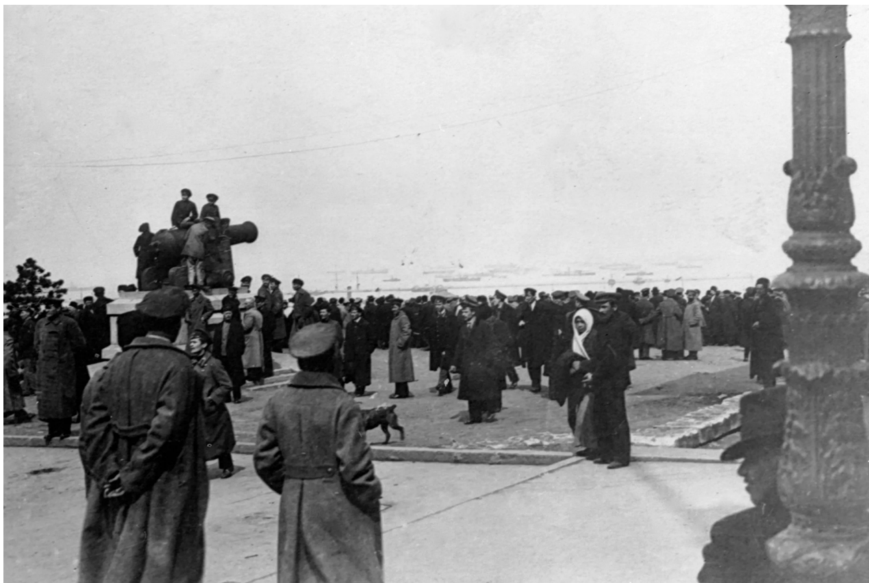
Místní obyvatelé na Mykolajivském bulváru sledují evakuaci francouzských jednotek z Oděsy, duben 1919.

Během první světové války byla Francie jedním z hlavních ruských půjčovatelů peněz. Francouzi ustupující z Oděsy se snažili odvézt vše, co mělo alespoň nějakou cenu. Odvezli tedy část lodí bělogvardějské flotily, které byly umístěny v Oděse.