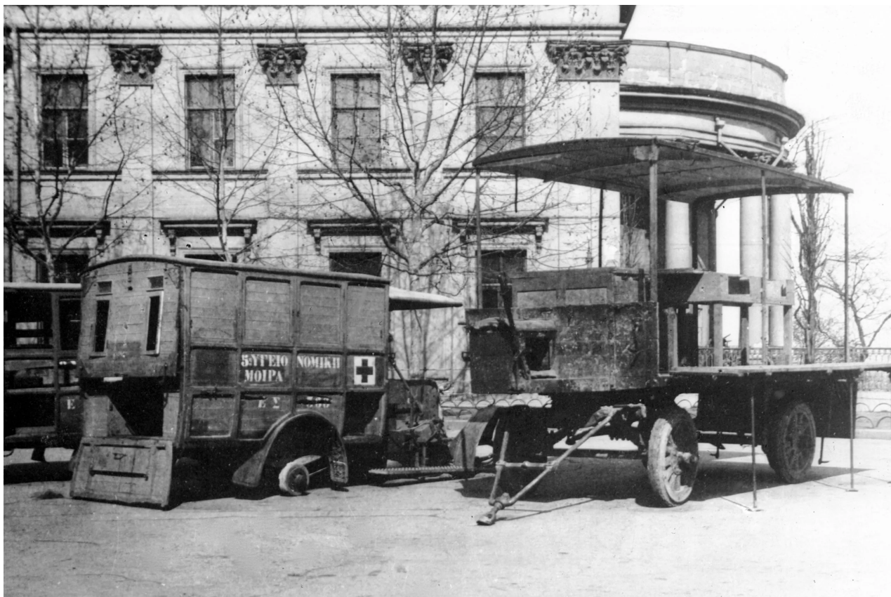
Zařízení zanechané Francouzi na náměstí Duma v Oděse po evakuaci, duben 1919.

V srpnu 1919 bělogvardějci vyhnali rudé z Oděsy. Nakonec byl ve městě v únoru 1920 nastolen sovětský režim.