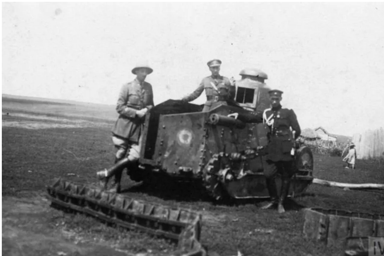
Důstojníci britské vojenské mise na jihu Ukrajiny na francouzském tanku Renault, 1919.

Flotila Entente vstoupila do Černého a Azovského moře a jejich jednotky vstoupily do Oděsy, obsadily Sevastopol, Feodosii, Jevpatorii, Jaltu, Kerč, Simferopol, Cherson a Mykolajiv. To se nelíbilo Chersonskému atamanovi Ukrajinské národní republiky Nikiforu Hryhoryivovi, který se spolu se svými vojáky přidal k bolševikům.